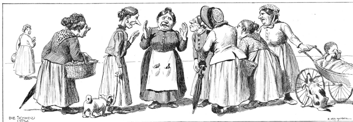
„Wie kann man auch so viel Geld für ein Fest wegwerfen. Wenn ich allein auf der Welt wäre, würde ich alle Festzüge verbieten.“