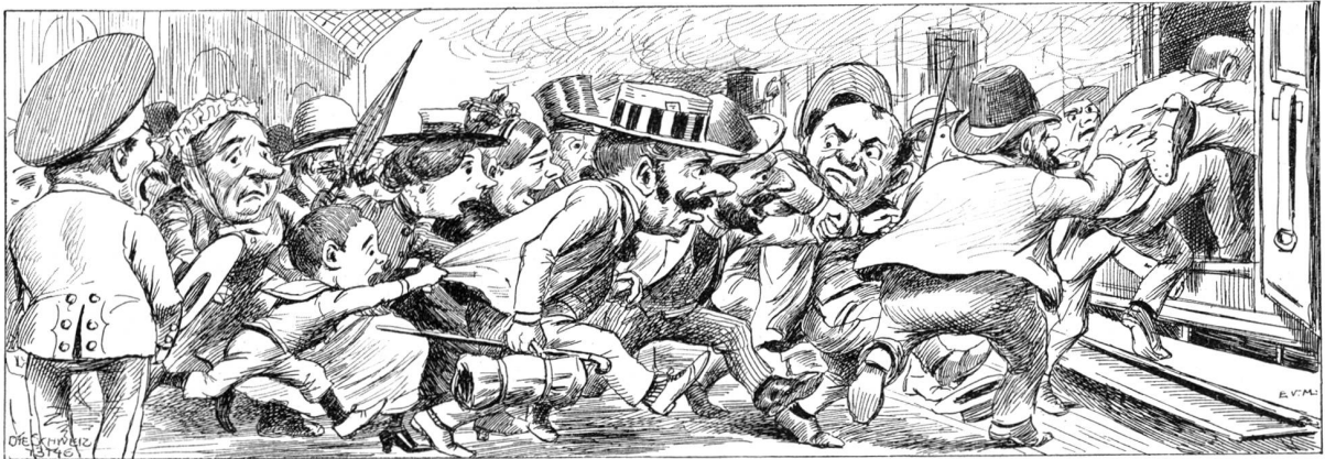
„Nach Immedinge, Singe, Thahnge, Schaffhause! — Festschbefeher hinte ei'fsteige!“