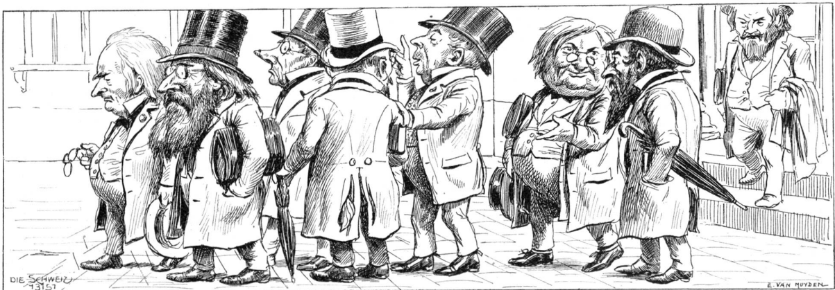
Die Festreporter begeben sich auf den Festplatz.