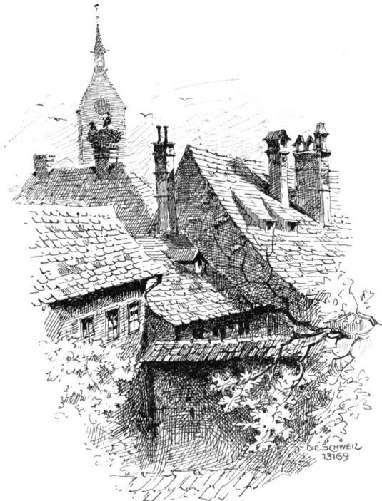
Dächer mit Storchennest in Basel. Originalzeichnung von J. Billéter.

W uh! wie het's hienecht gstimt und gsunst und As hätte sie im Himmel über Nacht [fracht, Mit Hundertpfündere gschosse; het der Sturm Nit Hyser abdeckt, guugt der Münsterthurm! Was soll das gäl! so frogt me; merksch denn nit, Der Sturmwind bringt, will's Gott, der frielig nit. Do schittlet er d'Schneeflocke uus em hoor, Do strait er Blume nuus mit Himmelsduft, Er wärmt is mit der Summe d'Winterluft, Bringt Lust und Fraid und Liecht; das het kei Gfohr. Und doch, bisch truurig gar? De gfallsch mer hit, I gstand der's offe, nai, de gfallsch mer nit.