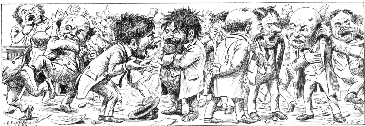
3. Zur Beratung.