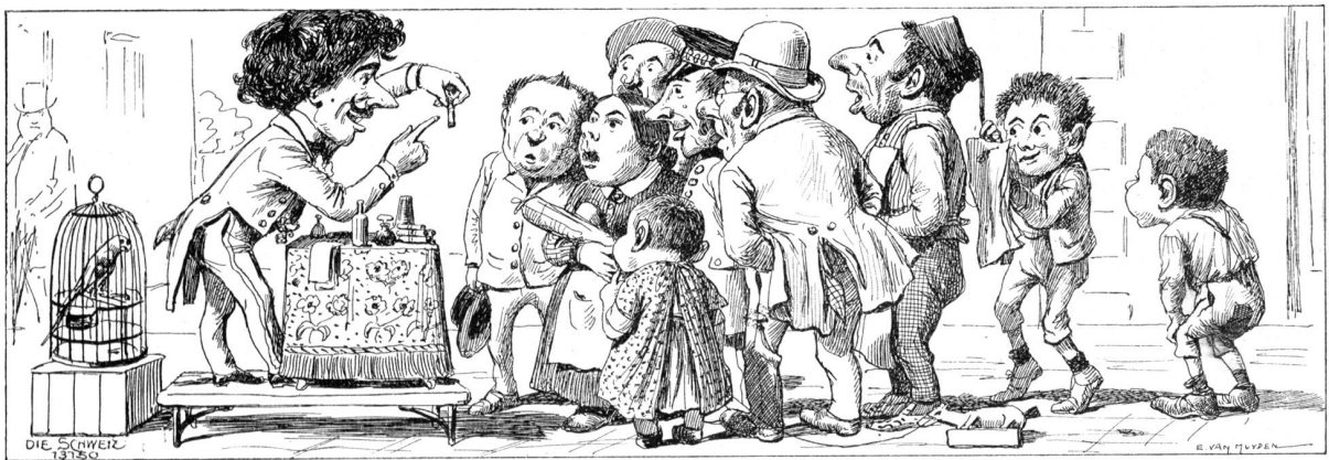
2. Aus Wissensdurst.