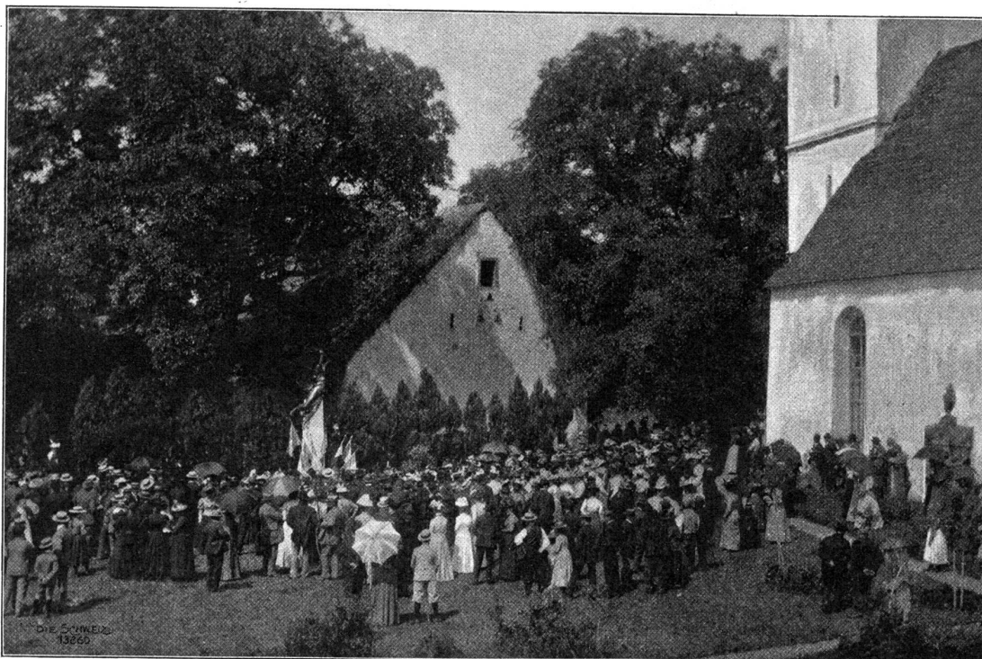
Die Einweihung des franzosendenkmals in Birr.

Stadt zeigen. Ich wollte jetzt sehen, ob er mir gefalle; es sei nachher Zeit genug mit dem Ältesten zu sprechen. Die Glaubensbrüder gingen mir aber nicht vom Halse und unter ihren Augen wurde ich mit großer Freundlichkeit und Zuvorkommenheit von der Herrschaft aufgenommen. Die Leute er- suchten mich, sogleich dazubleiben; denn sie haben mich sehr nötig; was mir natürlich sehr lieb war.