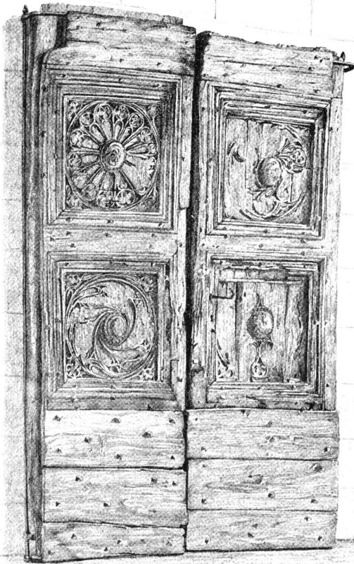
Schweizerisches Landesmuseum: Gotische Hausthüre aus dem Hause der Familie Supersax in Elten. Anfang 16. Jahrhundert. Originalzeichnung von Sophie v. Wob, Zürich.