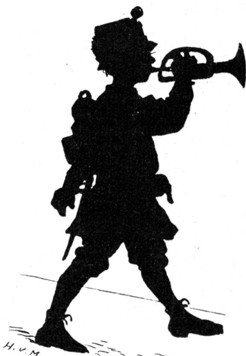
Ich hatt' einen Kameraden.

Die Kleine wurde ganz blaß und schlang ihren Arm beschützend um Friedrich Wilhelm.