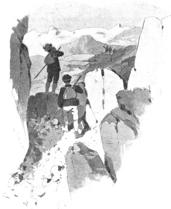
Abstieg durch's Firnenloch: „Da Chamä glaubi agä.“