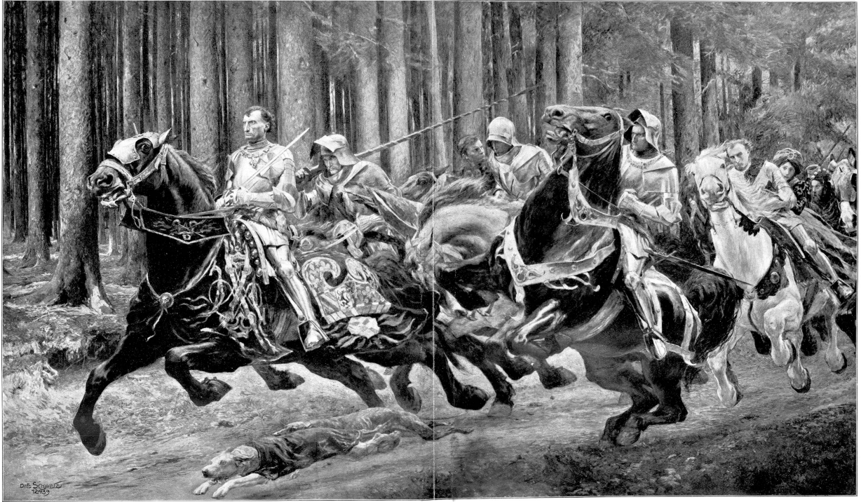
Karl der Kühne auf der Flucht. Nach dem Gemälde von Eugen Burnand, Moudon (Waadt).