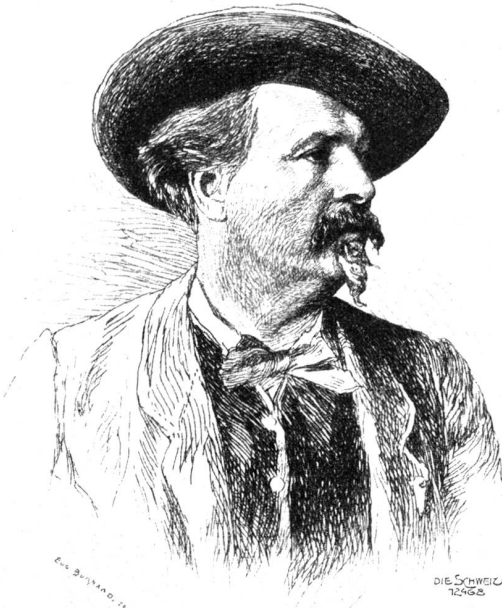
Portrait des provençalischen Dichters Mistral. Nach einer Radierung von G. Burnand.

„Meinst du nicht, ich dürfe das Kind zu uns hinübernehmen?“ fragte Anne Marie ihren Mann. „Es wäre ja auch meine Pflicht“ — mein Recht, fiel ihr nicht ein zu jagen — „und meine ganze Freude.“