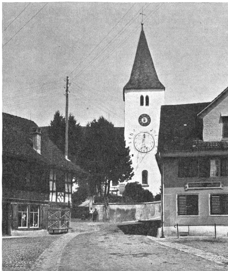
Märktetten im Thurgau. Dorfplatz mit Kirche.