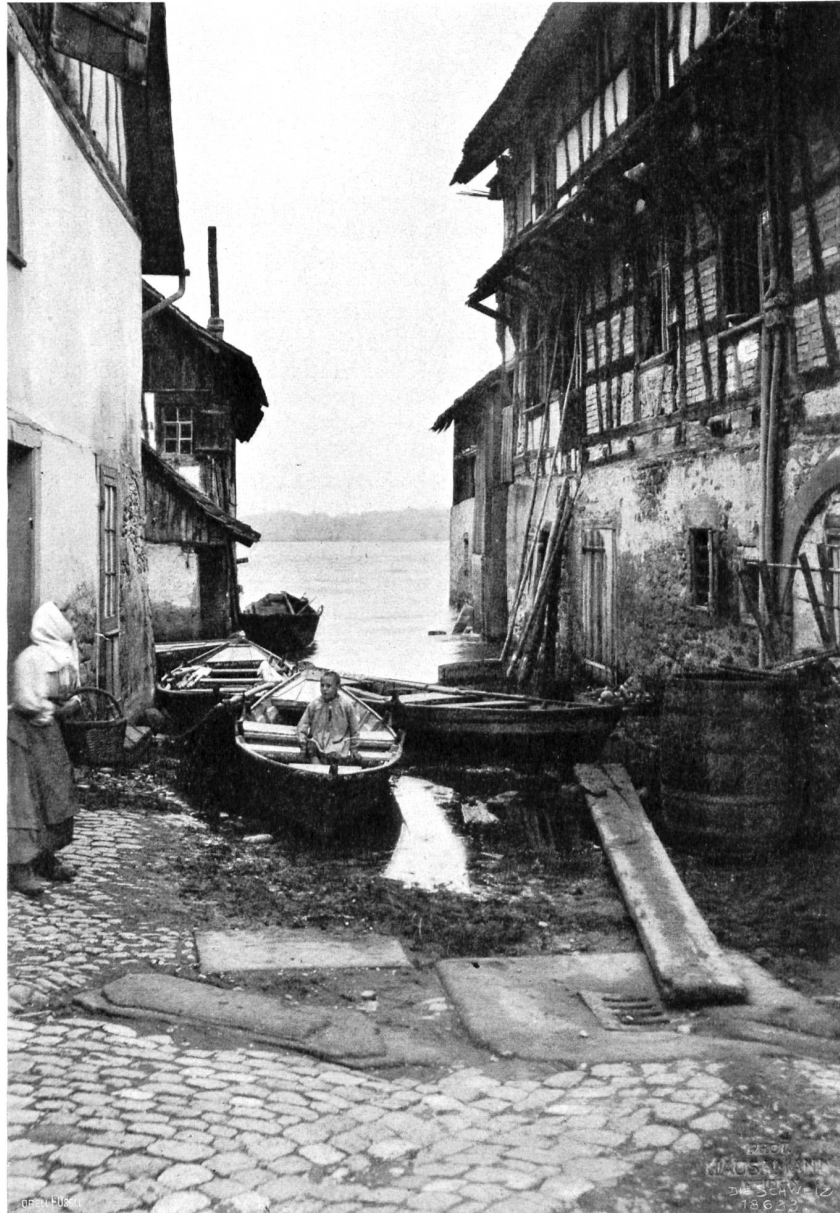
Häusergruppe in Berlingen.