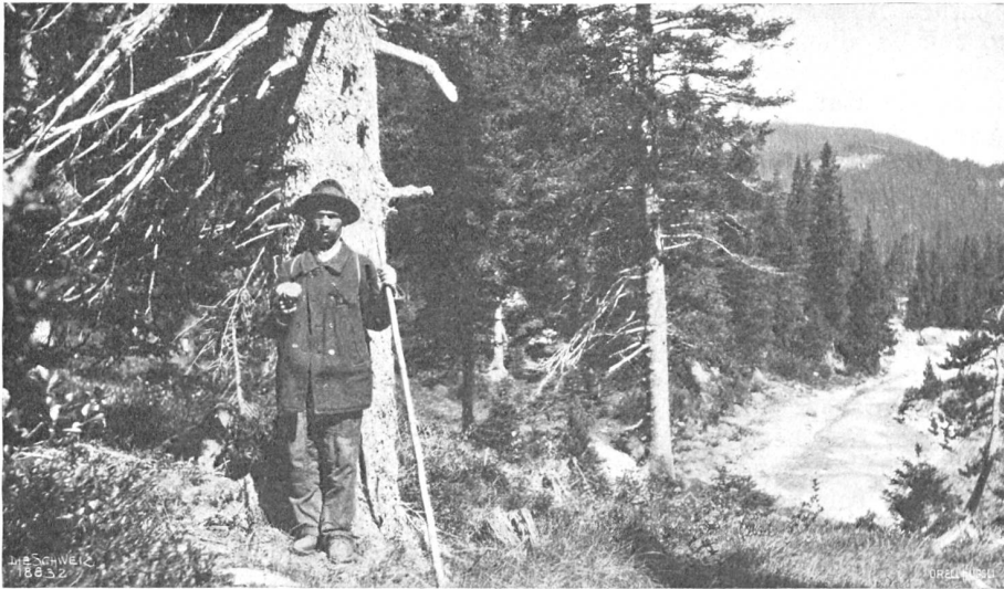
Schanfiggtaler auf der Pirsch.

Eines verschwieg er ihr ganz: sein ehemaliger Meister war ihm äußerlich etwas vernachlässigt vorgekommen. In solch schäbigem Aufzug hätte er sich vordem nicht außer Dorfes sehen lassen.