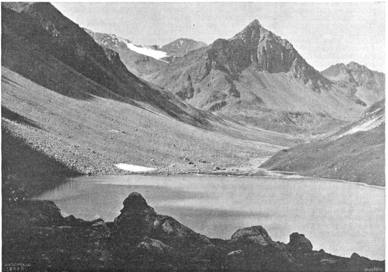
Der Hesppli-See ob Hroia (2150 m).