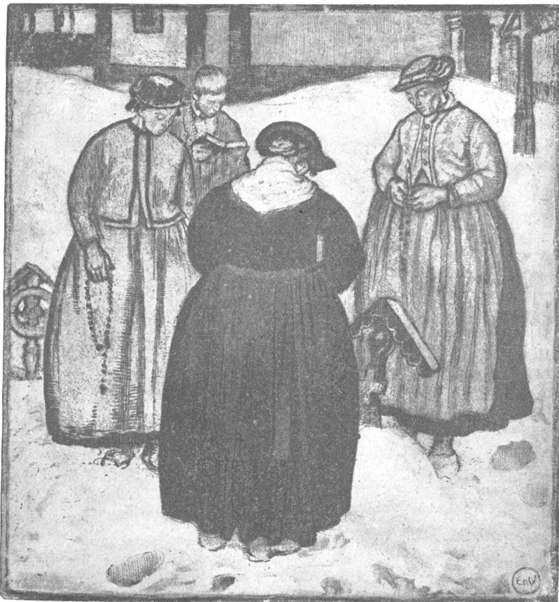
Edouard Vallet, Genf.

Charakteristisch für Ballet ist, daß er die Formen sehr einfach behandelt. Alles Kleinliche unnötige Detail bleibt ausgeschaltet, nur das Notwendige ist gegeben. So einfach die Form ist, wirkt sie doch reich und vollständig, eben weil sie das Wesentliche enthält. Und eben darum ist sie auch sehr ausdrucksvoll. Diese Einfachheit in den Ausdrucksmitteln — sie ist es, welche die dekorative Wirkung der Radierungen verbürgt — erscheint in den allerletzten Werken noch gesteigert, ja in einem Blatt wie dem „Heuet im Gebirge“ (s. zweite Kunstbeilage) bis zu eigentlicher Monumentalität. Eine „monumentale Radierung“! Das scheint fast ein Widerspruch in sich selbst. Doch kann man den Eindruck dieses (auch an Umfang großen) Blattes kaum anders kennzeichnen. Der Technik ist dabei nichts Ungehöriges, Stilwidriges zugemutet. Es ist nur Alles ungeheuer einfach und kraftvoll. Daß Ballet bei diesem Streben neuerdings auch ein großes Format zu bevorzugen beginnt, ist begreiflich. Seine Radierungen sind aber