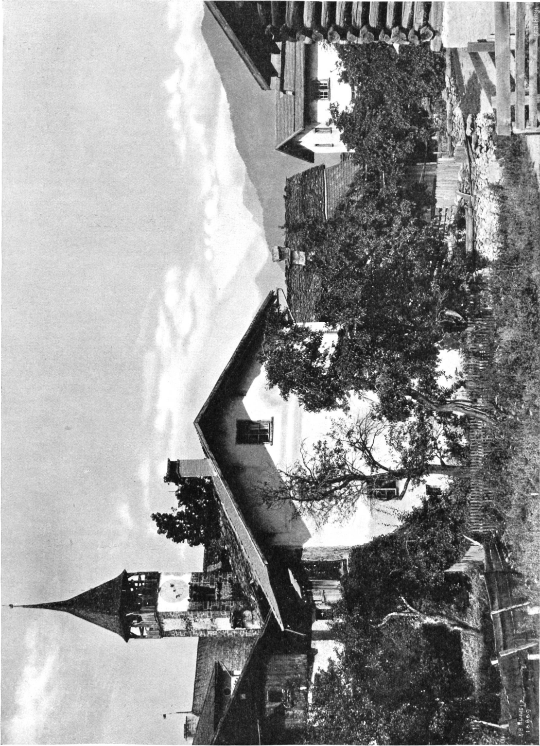
Scharans im Domleithg. Bad photographischer Aufnahme von Domenic Hiltbol, Scharans.