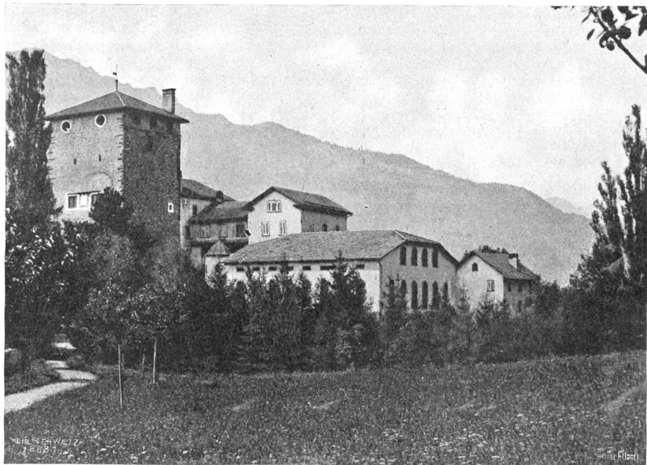
Rietberg ob Rodels (im innern Domleschg), von der Almenfer Seite.

Ein wilder Windstoß, der die Höhen herabgedonnert kam und die Pappeln am Weg halb zur Erde neigte, die Apfelbäume zaufte, daß die kahlen Nester knackten, und pfeifend durch die Fugen und Ritzen der Dächer tobte, weckte sie auf aus ihren Träumen. Sie wollte schlafen, ein letztes Mal schlafen. Aber sie fand keine Ruhe. Die Gedanken wälzten sich in ihrem Kopf. Ein Entschluß neigte zur Reife, und Pläne über das Wie ließen sie nicht los. Morgen, ganz früh, wollte sie zum Herrn Pfarrer eilen und ihm sagen, daß es nicht sein soll. Sie wollte ihm gestehen, alles, alles wollte sie sich von der Seele herunterbeichten. Möchten sie sagen, was sie wollten, die andern. Möchte geschehen, was geschehen mochte. Nur nicht diese Lüge, diese große, schändliche Lüge! Ob sie den Mut habe, zu tun, was sie tun wollte? Und Mutter? Was hatte sie gelobt? Was hatte sie geschworen? Mutter!?