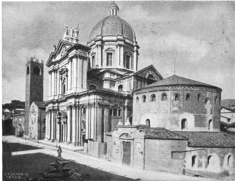
Brescia Abb. 1. Domplatz. In der Mitte der Dom (Duomo nuovo), l. der Broletto mit «Torre del Popolo», r. die «Rotonda» (Duomo vecchio).