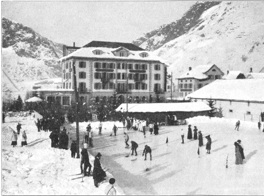
Curlingmatch vor dem Hotel Danioth in Andermatt.

Am 29. November in St. Gallen ein Veteran des schweizerischen Telegraphendienstes, alt Telegraphendirektor Friedrich Gschwind-Walser, im Alter von 81 Jahren.