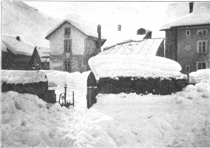
Winterbild aus Andermatt.