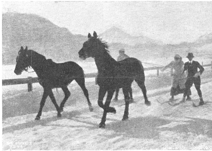
Fröhliche Skijöringfahrt auf dem St. Moritzersee.

Die im menschlichen Körper während eines Jahres verbrauchte oder unnütz vergeudete Kraft ist nach der Ansicht eines Fachmannes hinreichend, um eine große Dynamomaschine