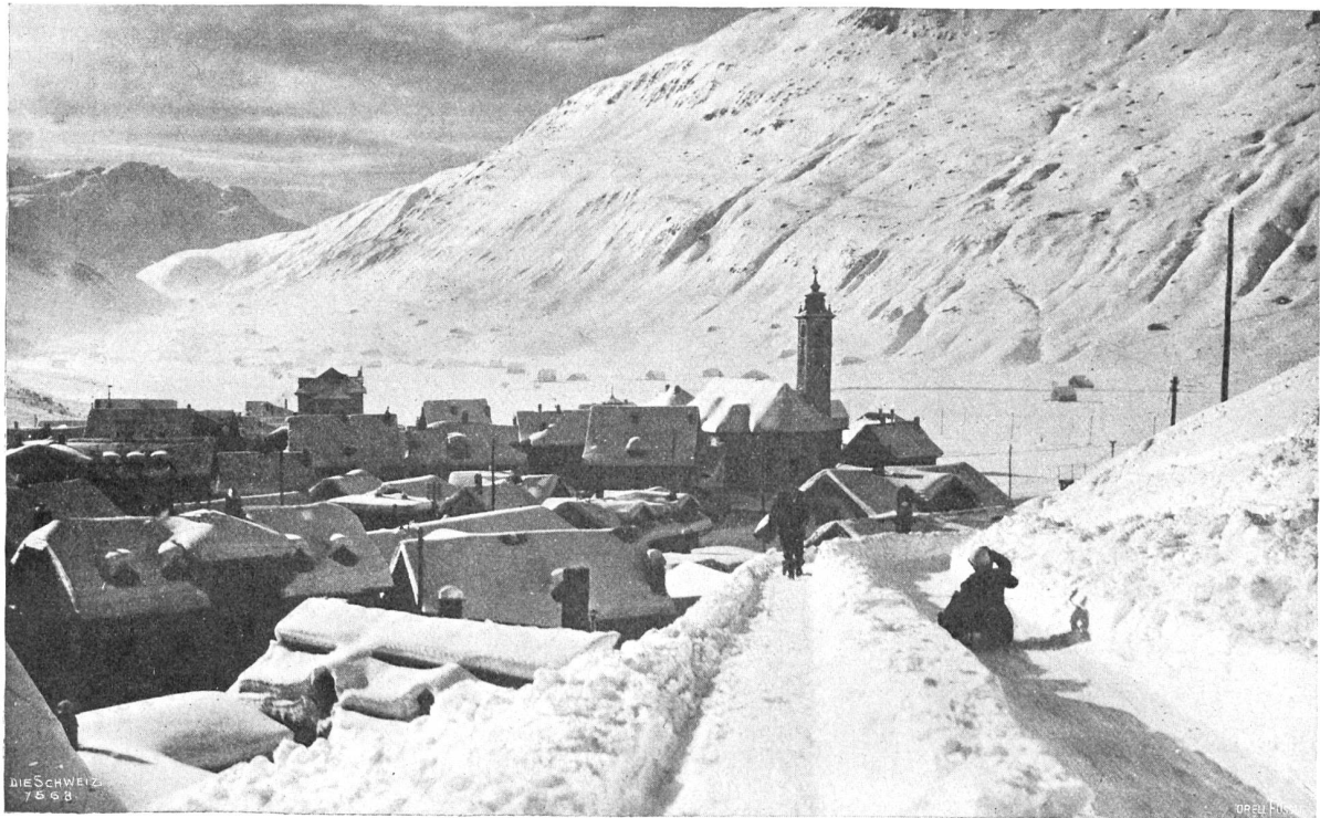
Andermatt im Winter.