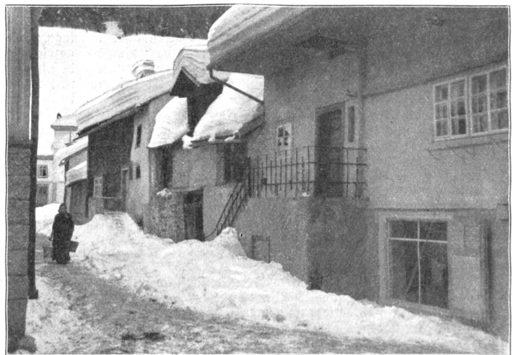
Winterbild aus Andermatt.

mehr als einmal davon Kunde geben. Eine Zusammenstellung Goethescher Äußerungen über diese Probleme, die kürzlich in der „Deutschen Luftschiffahrt“ veröffentlicht wurden,