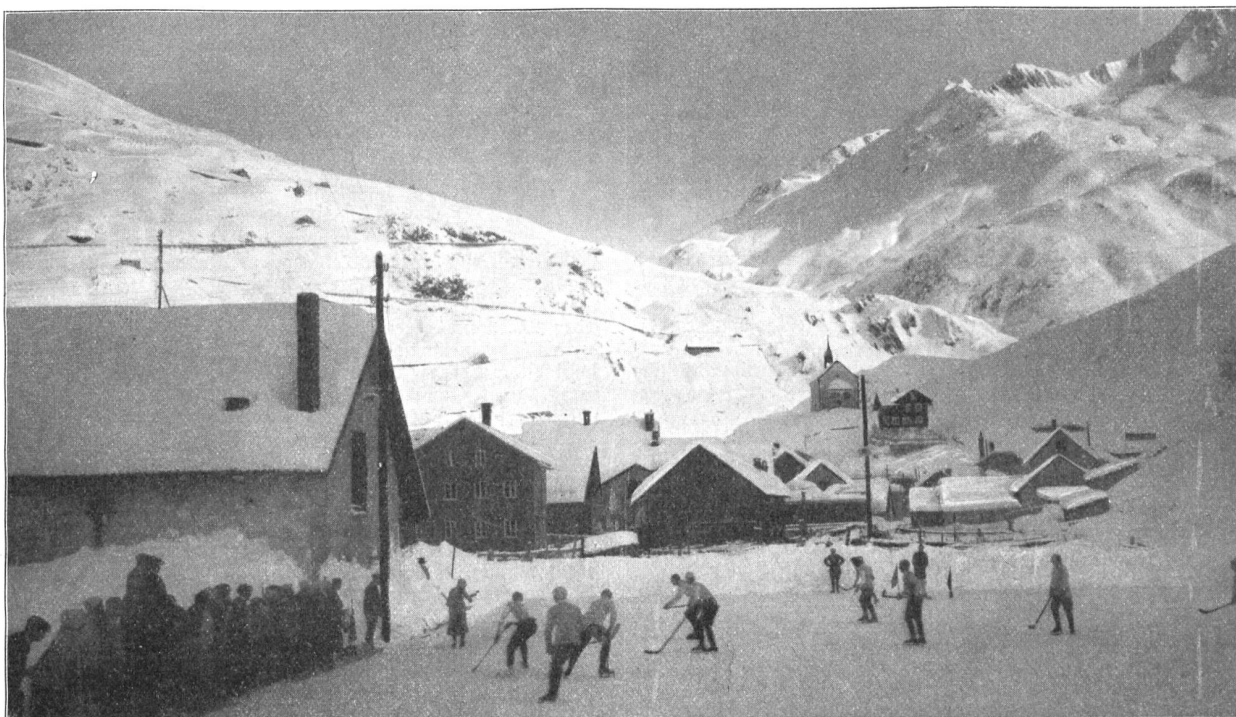
Hockeysport in Andermatt.

Wenn die Dämmerung über dem Urserental steht, der Mond die schneehelle Landschaft übergießt und der Oberalpstock, der Crispalt und fern der Galenstock und seine Kameraden in schar-