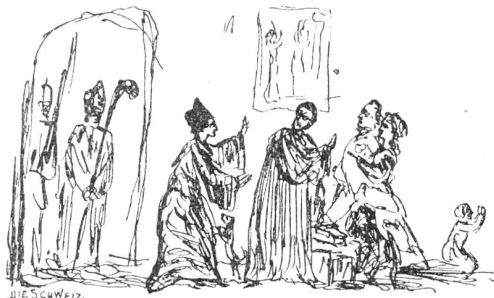
Aus J. V. Widmanns Skizzenheften.