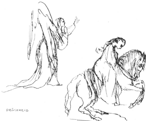
Aus J. V. Widmanns Skizzenbüchern.

Gottlob zwar, daß sie's tat. Es war Dahüt, Azenors Schwester, die zu ihrem Lehrer Mich auserfor, von Wissensdurst durchglüht. Nie fiel das Lehren einem Meister schwerer! Dem was ihr nur durchs tolle Köpfschen sprüht, Will sie erfahren: „Mein Malduk, erklär' er Mir dies und das, warum die Blumen riechen, Die Sterne schneuzen und die Schnecken kriechen!“