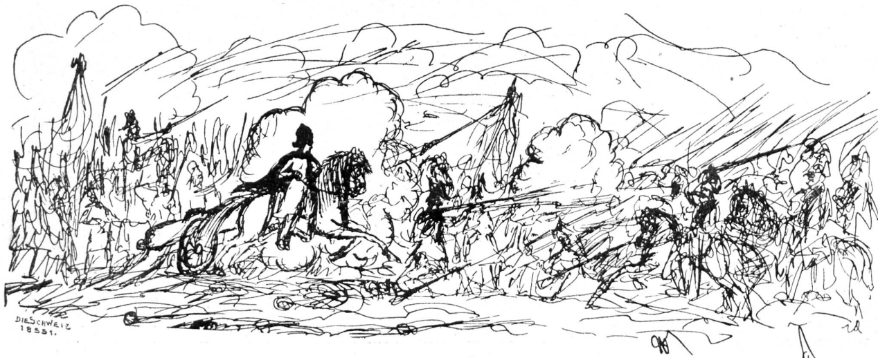
Aus J. V. Widmanns Skizzenheften.

Welches Glück — es muß noch einmal gesagt werden — diese Einheit des Dichters mit seinem Lande und Volke! Er hat ein Vaterland, und das Vaterland hat ihn. Kein Blättchen rauscht zu oberst in den Wipfeln dieses Baumes, das Gestalt und Kraft nicht dem Saft verdankt, den die tiefen und die weit verbreiteten Wurzeln aus der Muttererde gesogen haben. Jeder Dichter schreibt seine subjektiven Gefühle und Phantasien. Vaterlandslose oder — wie Chamisso — mit zwei Vaterländern „gesegnete“ Dichter schweifen jedoch sehnsuchtsvoll, unruhig um ferne, unwirtliche Klippen; gleich Wandervögeln fassen sie nirgends für lange festen Fuß. Anders der Vaterlandsdichter! Auch Bihius dichtete seine Subjektivität. Aber siehe da, sie war die größte Objektivität, sie war sein Volk!