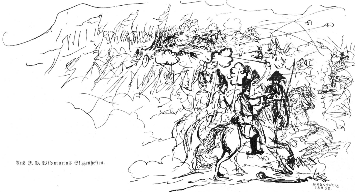
Aus J. V. Widmanns Skizzenheften.