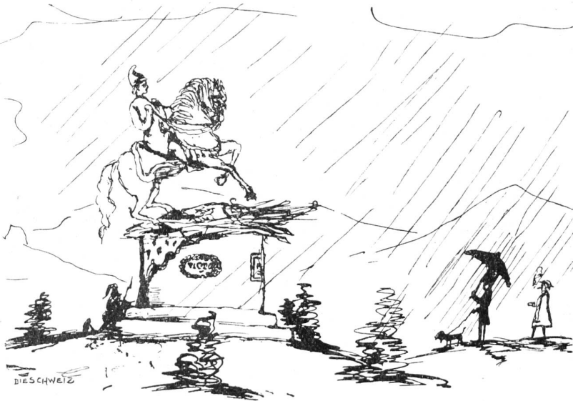
Aus J. V. Widmanns Skizzenheften.