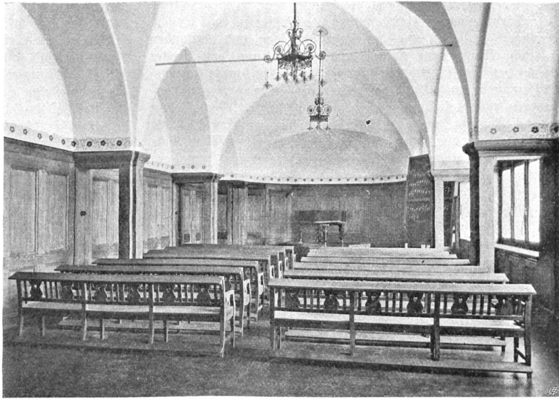
Stäpferichulhaus in Brugg Abb. 7. Singaal im Dachgeschoß.

War die Einrichtung des Hauses charakteristisch zürcherisch, so war es seine Umgebung nicht weniger. Doch all das nur so, daß dem Traubenberg seine Individualität unbedingt gewahrt blieb. Vom See her kennzeichneten ihn das Badhäuschen mit den Kastanienbäumen und das große Tor mit der blauen Traube, vom Berg her die hohen Tannen hinterm Haus. Sonst aber war, wie bei allen unsern Bauernhäusern, auf der einen Seite der Baumgarten, wo an schönen Sonntagen alle Gäste, die angemeldet oder unangemeldet kamen, an einem langen Tisch bewirtet wurden, auf der andern Seite über dem Hof, drin oben wie ein Fürst der Brunnen thront, der eingehegte eigentliche Garten. Man fängt heute wieder an — allerdings meist nur auf dem Papier — solche Gärten anzulegen, die keine Rasenstücke und Gebüschgruppen haben, sondern lauter symmetrisch geordnete Beete und an einem Ende eine Laube. Der Traubenberger Garten war dafür da, daß möglichst viel Blumen drin wuchsen und in einem Seitenteil möglichst viel Gemüse. Deshalb durfte die Sonne zu, soviel sie mochte. Runde,