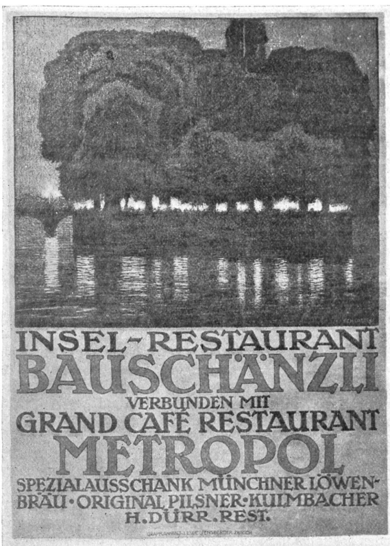
Ernst Emil Schlatter , Zürich. Plakat für das Bauschänzli-Restaurant in Zürich. Druck: Graph. Anstalt J. C. Wolfensberger, Zürich.

Ich wandere durch das Rheintor aufs offene Land hinaus. Rheinhausen ist mir lieb geworden. Ein alter, stets ehrlicher Geruch, ein ungestörtes Wohlleben und ein wackerer Menschenschlag sind an dem Städtchen hängen geblieben. In verschwiegenen Rheinhauser Kneipen mag man diese Menschen noch finden. Da hocken sie bei einem Sumpfen zusammen und reden über Tagesereignisse, bedächtig und langsam — treffend und