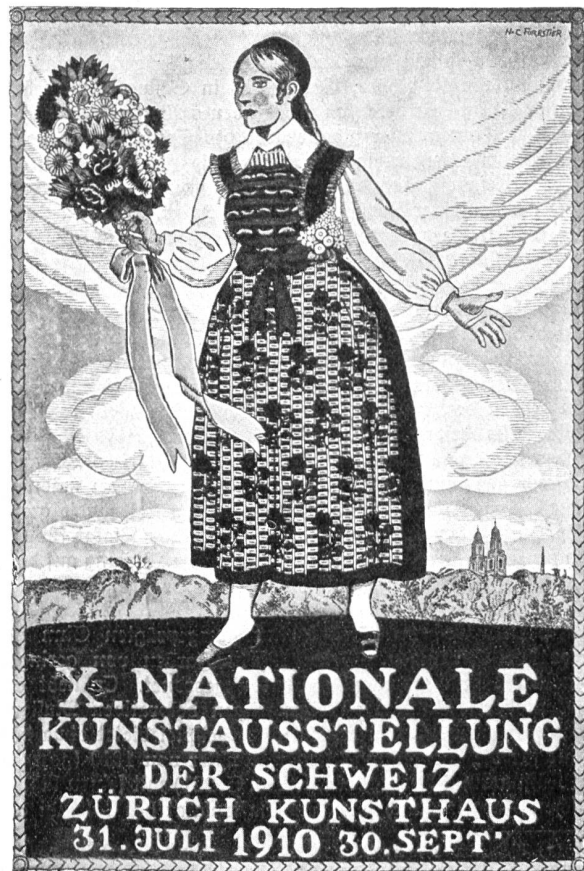
Henri Claude Foretier, Genf. Plakat für die X. Nationale Kunstausstellung der Schweiz, Zürich 1910. Druck: Graph. Anstalt J. E. Wolfensberger, Zürich.