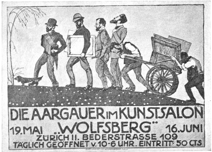
Ernst Bolens, Aarau. Plakat für die Ausstellung der Aargauer im „Wolfsberg“ Zürich. Druck: Graph. Anstalt J. C. Wolfensberger, Zürich.

Das Lied verweht in den silbernen Weiten, Die Rosen entschlummern im kühlenden Licht ... Ich warte. Ich will meine Hände ausbreiten Und wach sein, daß niemand die Rosen mir bricht.