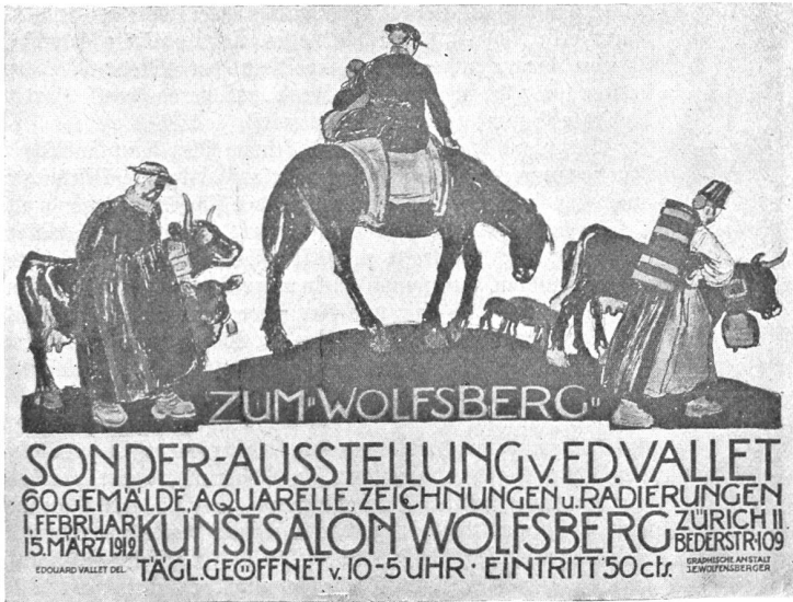
Edouard Vallet, Genf. Ausstellungsplakat. Druck: Graphische Anstalt J. E. Wolfensberger, Zürich.

Ich schaffe weiter. Das Heu muß doch eingetan werden, und die Tiere wollen doch fressen. Eine Verwandte des Bendener besorgt den Haushalt. Sie hat ein runzliges Gesicht und blöde Augen und eine heifere Stimme.