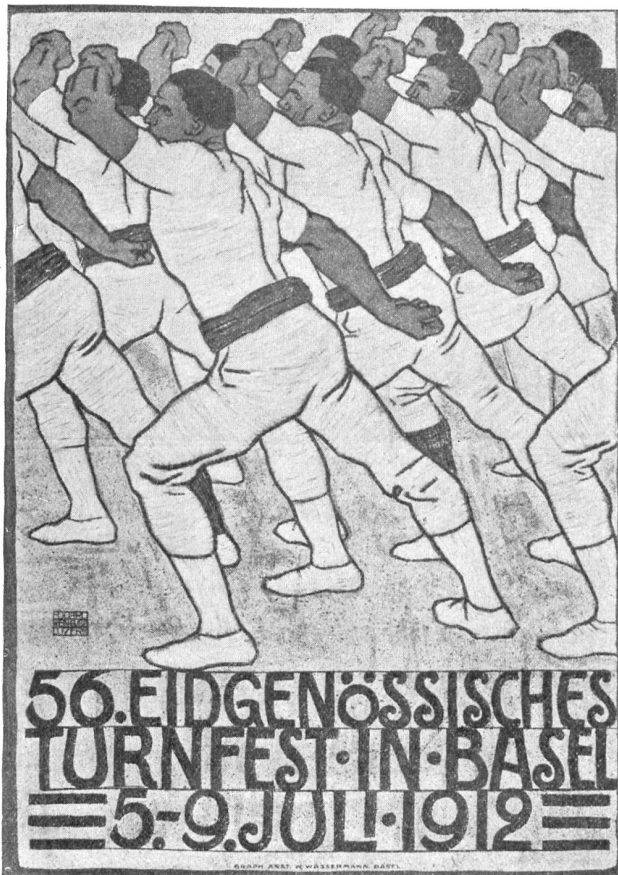
Eduard Renggli, Luzern. Plakat für das Eidg. Turnfest in Basel (1912). Druck: Graph. Anstalt W. Wassermann, Basel.

Im Garten unten blühen Rosen. Der Mondschein streichelt sie. Sie leuchten. Ein Rauschen geht durch die Nacht. Vielleicht streicht der Nachtwind über den See. Bei Fluris Heimet kommt jemand vorüber und singt. Ich sehe den schwarzen Schatten. Ich blicke auf die dunkeln Rosen. Dann stehe ich auf und