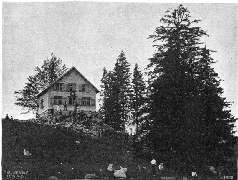
Die Bütte der Arbeiter-Naturfreunde am Säntis.

und Liebe, kaum daß sie sie zu fassen glaubt, immer wieder zerrinnen, vermag sich in dem Schwulst von hohler Theatralik und verlogenen Pathos nicht geltend zu machen. Zwischen diesen beiden robusten und lauten dramatischen Erzeugnissen stand Maeterlincs „Aglavaine und Schlysette“. Lieft man die rührende Geschichte von der armen kleinen Schlysette, die um das Glück ihres Gatten und der von ihm geliebten Frau nicht zu stören, eigenes Glück und Leben opfert, wird man wundersam ergriffen von diesen Szenen voll vibrierender Innigkeit, von dem süßen Duft, der ihnen entströmt. Aber man legt auch das Buch mit einem Zweifel an die Bühnenfähigkeit des Dramas aus der Hand; man fragt sich, werden diese stillen Zwiegespräche, durch die ein leises Beben gequälter Seelen wie das Zittern einer Saite geht,