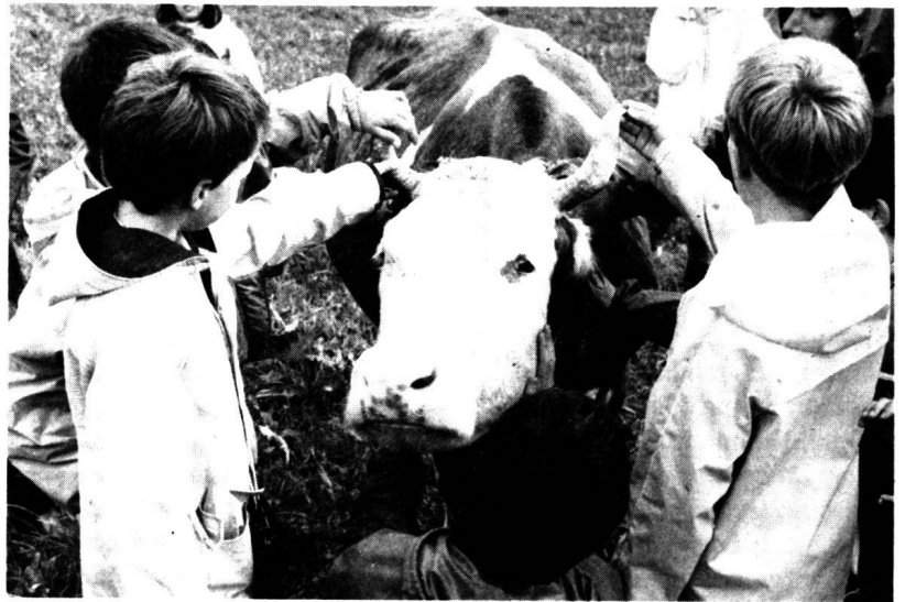
Les élèves sont invités à toucher (ici au Mont-sur-Lausanne)

entreprise un petit côté «reconstitution artificielle»: il n'y a plus guère qu'au musée du Ballenberg que le pain soit fait de cette façon et celui que nous mangeons passe par des étapes beaucoup plus mécanisées. Mais qu'importe, pourvu que la démarche soit honnête: les visiteurs peuvent être avertis et deviendront d'autant plus critiques face à des produits de facture industrielle, ou exigeants dans la recherche de produits de qualité. L'honnêteté est également nécessaire pour bien comprendre la relation entre l'homme et l'animal: les si jolis petits lapins qui courent dans l'herbe sont destinés à être tués, tout comme les vaches ou les poules. Pour éviter le côté «musée», il est important, selon Bruno Dumont, animateur de l'expérience lausannoise (voir encadré), que «les enfants vivent la ferme. Ils ne viennent pas regarder des vitrines, mais participer aux tâches: nettoyer l'écurie, s'occuper des bêtes, du jardin, etc. Ils y vivent des moments forts, parfois difficiles, lorsqu'ils se rendent compte qu'il faut tuer une poule ou que les lapins