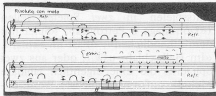
Beispiel 7: «Zanken 3»

Die Zankspiele, die sich im Vorfeld von Kurtágs Zankstücken ( Beispiel 7 ) spielen lassen, können demonstrieren, dass das Entziffern von Noten und Zeichen kei- nesfalls der direkteste Weg ist, um an notierte Stücke heranzukommen. Oft erhält man eine gründlichere Einsicht in Notationsformen, wenn man sich vor- erst auf eigene Faust mit der gestellten Aufgabe beschäftigt, das heisst in diesem Fall, auf eigene Faust zankt. Aber auch Kinder, die bloss zuhören, werden die Stücke anders aufnehmen, wenn sie eben vom Streiten kommen. Allerdings würde die Anweisung