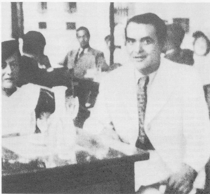
Letztes bekanntes Foto von García Lorca (Juli 1936 in Madrid)