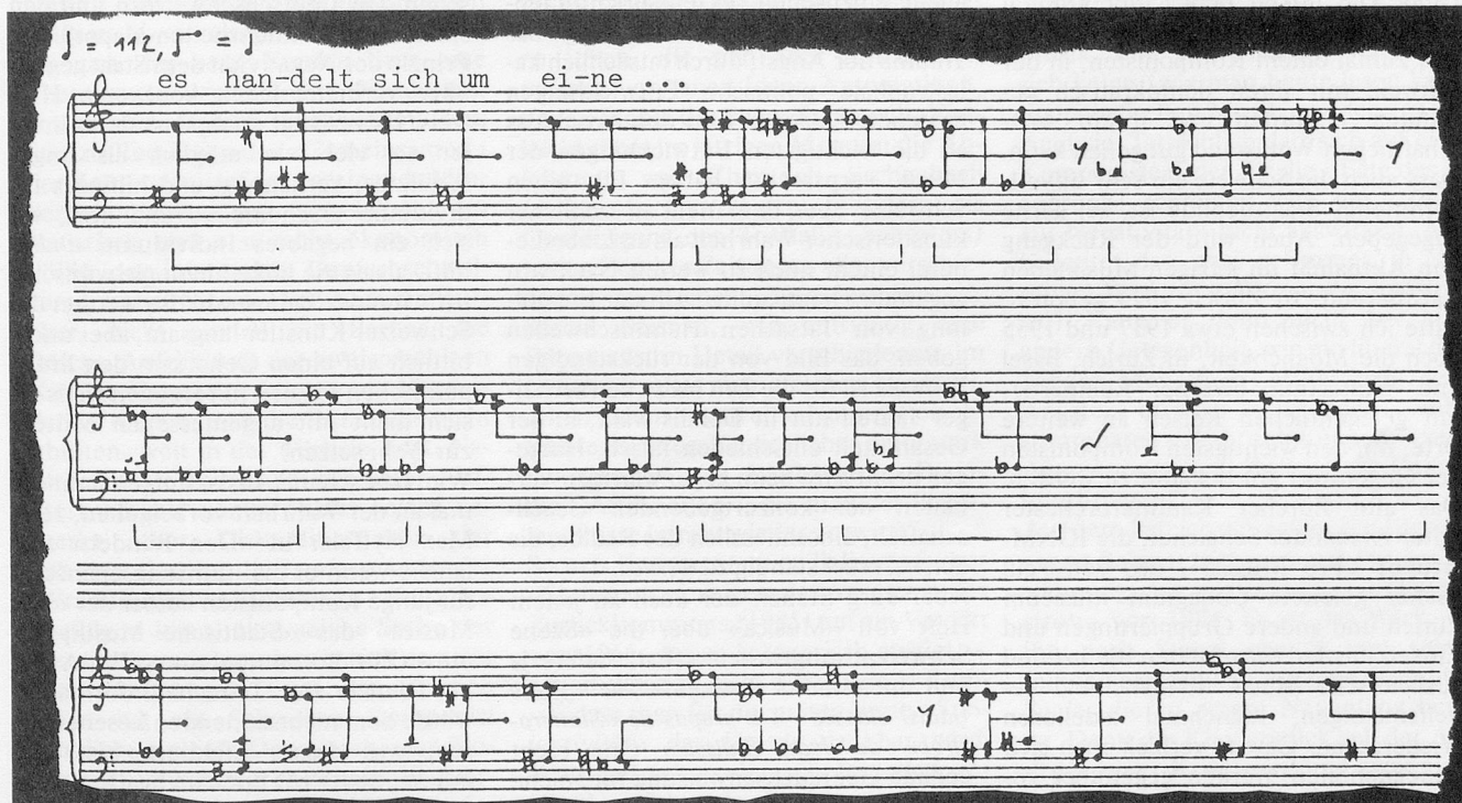
Exemple 5: gerhard rühm, pornophonie