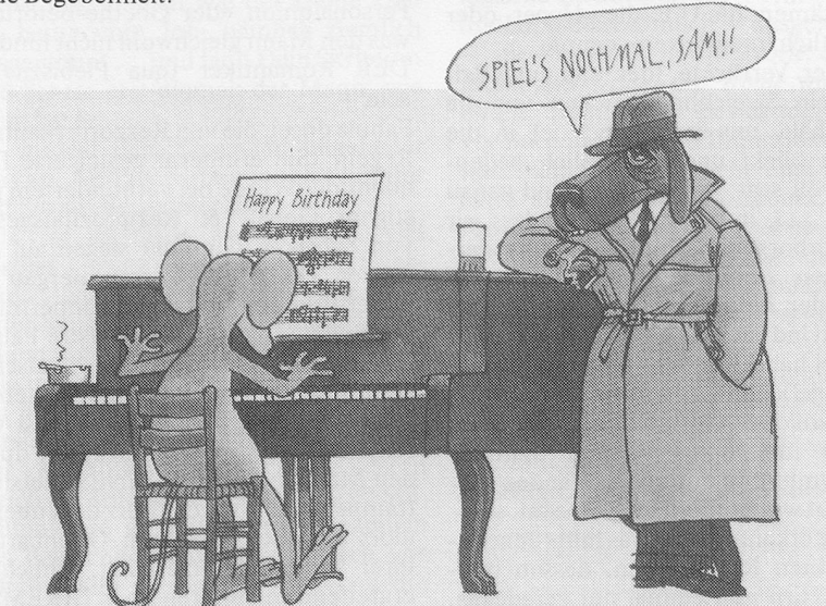
Postkarte von Sven Nordqvist, Copyright by Pictura Graphica Heidelberg 1984 13