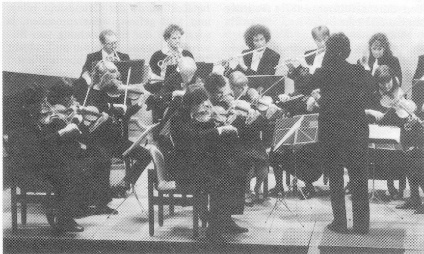
Grösserer Spass an der Orchestertätigkeit...

Ein erster Versuch – unter der Ägide eines grossen Unternehmens –, alle MusikerInnen zu bezahlen (Fr. 1400.– pro Mitglied für eine Tournée mit zehn Konzerten) brachte zwiespältige Erfahrungen. Einerseits erhöhten die vielen Auftritte das spieltechnische Niveau, die Sicherheit des Ensembles, andererseits führten ökonomisches Denken und die Anstrengungen der Tournée zu einer gewissen Kraftlosigkeit, Uninspiriertheit der musikalischen Aussage, also genau zum Gegenteil des Erhofften. Diese erste ernüchternde Erfahrung mit der Faktizität des Ökonomischen, aber