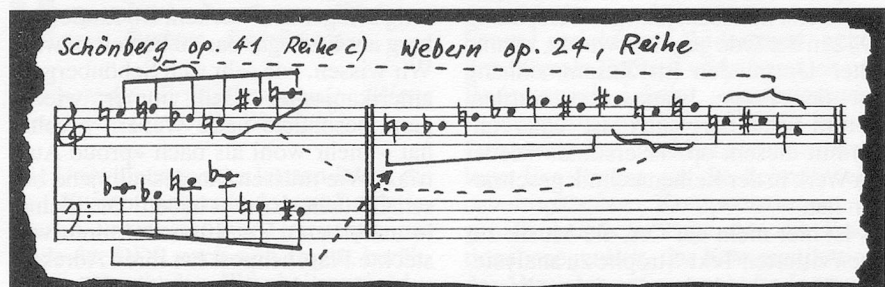
Beispiel 1 (Schönbergs eigene, typische Aufzeichnungswaise verwendend: mit zwei spiegelbildlich komplementären Sechstongruppen)

Die Stelle basiert auf einer Reihe, die derjenigen von Weberns Konzert op. 24 zum Verwechseln ähnlich ist. Das Faktum von zwei Reihentabellen bei Ru-