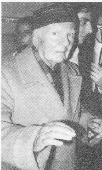
Une des rares photos de Giacinto Scelsi

Il fut un temps, pas si lointain, où il était de bon ton de se déclarer adepte inconditionnel 1 de Scelsi, voire de sa musique 2 , voire encore de son monde mystique – ou autres tiques. Mais les modes et leurs souteneurs se volatilisent, telles fumerolles, et c'est bien ainsi. Demeurent ceux qui s'acharnent, et perdurent. Ces nombreux enregistrements 3 , fait rarissime pour un compositeur contemporain, sont là pour en fournir une preu-