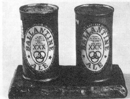
Jasper Johns: Ale Cans, bemalte Bronze (1964)

Bislang war stets vom ökonomischen Wert der Kultur und Kulturförderung die Rede. Nicht zu beziffern ist hingegen die kognitive, affektive und psychosoziale Funktion von Kultur für die sie beanspruchenden Individuen. «Sie hilft, emotionale Mankos zu decken, Erfahrungsverluste auszugleichen. Kultur schafft Spannung, Kultur erhebt, Kultur kitzelt die Seele. Kultur stiftet Kontakte und Kommunikation; im Höchsten stiftet sie Sinn. Der Kulturbetrieb trägt zur sozialen Stabilität bei. Schwer zu sagen, wie viele Klinikplätze, wie viele psychiatrische Behandlungen, wie viele Gefängnisplätze, wie viele Abstürze in Süchte der Kulturbetrieb der Gesellschaft vorbeugend erspart. Kulturproduktion hat stets mit Kreation zu tun, mit Erschaffen, mit Aufbau, mit Hoffnung, auch dann noch, wenn das Werk hämisch, böse, zynisch, respektlos oder niederreissend ist: Es bleibt ein Werk, ein aus dem Nichts Entstandenes.» 10 Die Gesellschaft nährt sich also noch in einer ganz anderen kompensatorischen Funktion als der erwähnten wirtschaftlichen von Kultur; werden deren UrheberInnen für diese gewaltige Leistung genug gewürdigt und entschädigt? Sicher nicht – und damit erweist sich ein