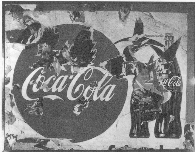
Wolf Vostell: Coca-Cola, zerrissenes Plakat (1961)

Kultursponsoring ist also nichts anderes als ein Teil der Werbemassnahmen eines Unternehmens und damit ein Mittel zur Gewinnmaximierung. Mit der Unterstützung von Kultur betreibt der Sponsor aber gleichzeitig auch Imagepflege. So wie im Werbespot mit Hilfe von sogenannter klassischer Musik als Klangkulisse eine Kaffeemarke und ihre KäuferInnen veredelt werden, ohne dass den AdressatInnen das explizit bewusst wird, verhilft der Einsatz der Wirtschaft für Kulturaktivitäten dieser zu einer positiven Ausstrahlung. Der Sponsor benützt Kultur gezielt, um sich einen guten Namen zu schaffen oder gar einen ramponierten Ruf zu polieren. Kultur hat damit eine kompensatorische Funktion: Die Grossen im Lande – Banken, Versicherungen, Chemische Industrie – machen in der gegenwärtigen Rezession traumhafte Gewinne; sie werden immer mächtiger und fallen ab und zu auch durch Skandale auf – Faktoren, die ihre Beliebtheit nicht gerade vergrössern. Da gibt Kultursponsoring die Gelegenheit zum Gegensteuer, zur Imagepflege, denn Kultur «macht» sich immer gut und läuft dem weniger vor-