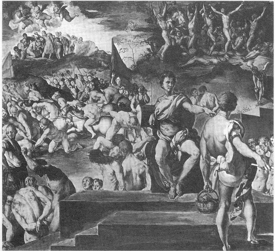
Bildbeispiel 2: Iacopo Pontormo, Das Martyrium der Elftausend

In einem Florenz, das immer autokrati- scher von der Bankiersfamilie der Medici regiert wurde, formierte sich im singfreudigen Bund der Oricellari die republikanische Opposition. Deren Ver- schworenheit schlug sich etwa in der von politischen Sympathien genährten Freundschaft zwischen Verdelot und Niccolò Machiavelli nieder. Als im Jahr 1525 ein Medici-Gegner aus dem Exil zurückkehrte, feierten die beiden den Anlass mit einer Komödie, genannt La Clizia , deren musikalische Zwi- schenspiele, im neuen madrigalesken Ton gehalten, wie ein griechischer Chor