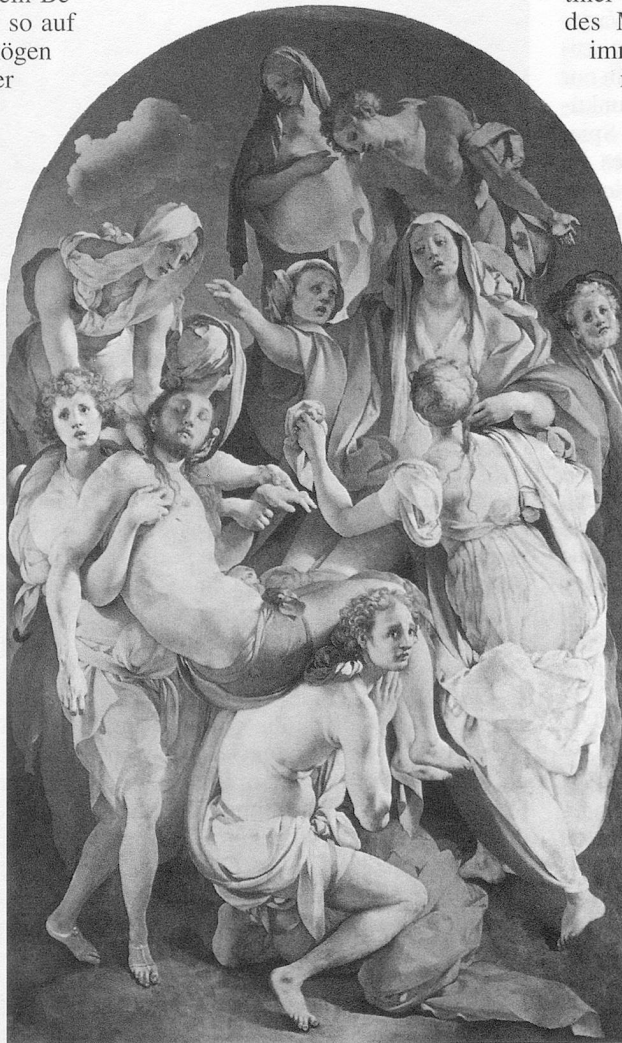
Bildbeispiel 1: Iacopo Pontorno, Grablegung

Auf seiner vermutlich im Jahr 1528 vollendeten «Grablegung» ( Bildbeispiel 1 ) gruppieren sich die Bestattungszeugen um den toten Körper Christi wie ein seltsam schwebender Trauerchor. Balancieren dabei doch diejenigen unter ihnen, die den Leichnam tragen und auf deren Füßen immerhin die gesamte Komposition ruht, auf Zehenspitzen, sodass alles Tun jeglicher Schwerkraft enthoben scheint. Sogar der heilige Kadaver selbst ist des meisten Gewichts verlustig gegangen, so wie er da als eine Art übergrosse Laute gehalten werden kann. Die Malweise lässt die gleiche Strategie der Entkörperlichung erkennen. Die hauchdünne Lasur der Farben lässt an vielen Stellen noch die Unterzeichnung durchscheinen. Zudem bewirkt sie, dass das