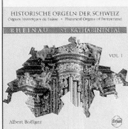
Vol. 1, Sinus 6001 Rheinau, St. Katharinental