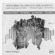
Vol. 2, Sinus 6002 Fisingen, Sitzberg, Mammern, Tänikon ...der zweite Teil einer bereits preisgekrönten Produktion... hervorragender Gesamteindruck... Singende Kirche 1996/2