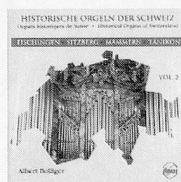
Vol. 2, Sinus 6002 Fisingen, Sitzberg, Mammern, Tänikon ...der zweite Teil einer bereits preisgekrönten Produktion... hervorragender Gesamteindruck... Singende Kirche 1996/2