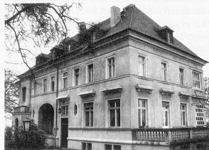
Dresdner Zentrum für zeitgenössische Musik

Selbstgemachte Jubiläumsgaben wie diese Festschrift zum zehnjährigen Bestehen des Dresdner Zentrums für zeitgenössische Musik haben primär musikpolitische Funktion: Man will der Öffentlichkeit – und speziell den Geldgebern – beweisen, was man geleistet hat, die Unerlässlichkeit eigenen Tuns