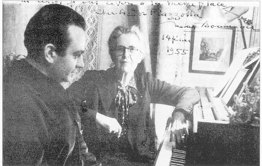
« Que bientôt je vous revoie à la même place, cher Astor Piazzolla » (dédicace de Nadia Boulanger, Paris 14 février 1955)

Là, c'était une fête, un divertissement: le saxo jouait, la batterie sonnait, puis c'était le tour du trombone... et ils étaient heureux. Parce que là, il y avait bien des arrangements, un chef, mais aussi une place pour l'improvisation, pour la jouissance et l'éclat de chacun des musiciens. Je me dis que c'était ce que je voulais pour le tango. Et effec-