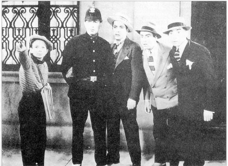
Piazzolla enfant tenant le rôle d'un crieur de journaux dans le film de Carlos Gardel « El día que me quieras ». Gardel est au centre de la photo.