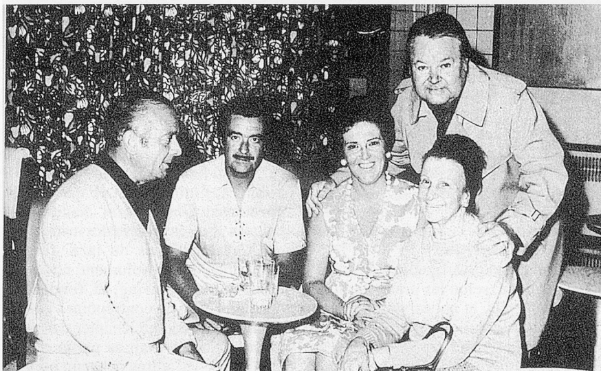
Piazzolla (deuxième depuis la gauche), Aníbal Troïlo (à droite) et des amis. Troïlo, dit « Pichuco », fut l'un des plus grands spécialistes du tango. Tout à la fois compositeur, joueur de bandonéon et chef d'orchestre exceptionnel, celui-ci a exercé une influence décisive sur le développement de la carrière de Piazzolla.

Piazzolla n'a jamais cessé de le reconnaître. A la mort de Troïlo, il composa une de ses œuvres des plus personnelles et émouvantes : la Suite troileana (1976). Aujourd'hui, en cet après-midi orageux, il est capable d'affirmer : « Ce qu'il faisait lui en 1940 était complètement lié au Buenos Aires de l'époque, ville sans télévision, moins bombardée par la publicité, et passionnée de bals. Si tu regardes un journal de cette époque, tu te rendras compte que tous les jours, on annonçait des douzaines de bals : par l'orchestre de De Angelis, celui de D'Agostino, de Canaro, de Pugliese — une centaine d'orchestres de tango, qui donnaient des bals tous les jours. D'Agostino ou D'Arienzo travaillaient beaucoup plus que Troïlo, parce qu'ils faisaient une musique plus simple, plus populaire ; mais moi, avec Troïlo, je réussis à donner trente-cinq bals en un mois. De plus, comme il y avait moins d'intermédiaires, il y avait une relation très intime entre les musiciens et le public. Et une quantité de créateurs extraordinaires : Manzi, Francini, Cadicamo, les frères Esposito, Discepolo, Troïlo, Stamponi, Catulo Castillo, Mores... De telle sorte que, toutes les nuits, on donnait un tango en première audition et que, littéralement, le matin suivant, c'était déjà un 'tube'. »