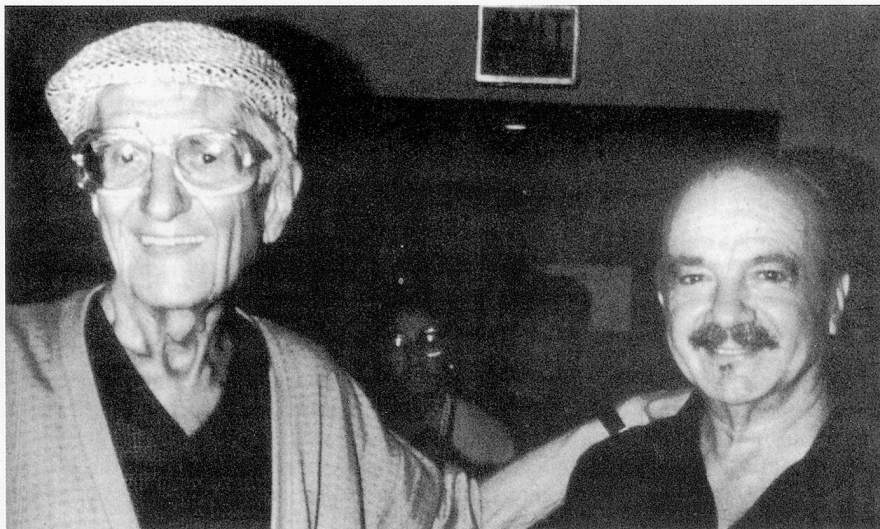
Piazzolla (à droite) et Gil Evans, New York 1986