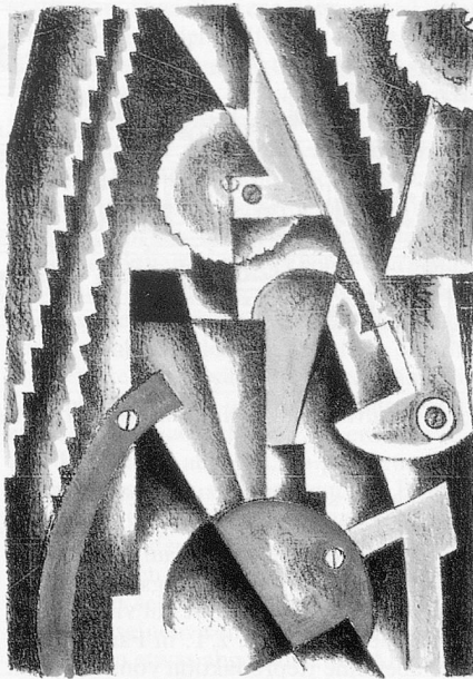
Thema Nr. VI – Lithographie von Otto Griebel

Consacré aux lieder de Schubert, et plus précisément à ses cycles inspirés par des poèmes de Wilhelm Müller, cet ouvrage met le lecteur à l'œuvre, car il se veut une contribution à l'interprétation musicale, ne servir à l'analyse musicale qu'à titre accessoire. Il ne prétend donc pas à l'exhaustivité, ne s'adresse pas à celui qui préfère céder à la séduction de ses disques, à l'attente de la confirmation de ce qu'il sait déjà ou croit savoir. L'auteur, en effet, ne veut pas accompagner la musique de mots, mais « dire quelque chose de déterminé sur une réalité musicale déterminée », en accordant une attention toute particulière au rythme. Grâce aux nombreux exemples musicaux jalonnant l'ouvrage, et qu'il conviendra toujours d'exécuter concrètement, le lecteur pourra suivre plus aisément la démarche de l'auteur. (vdw)