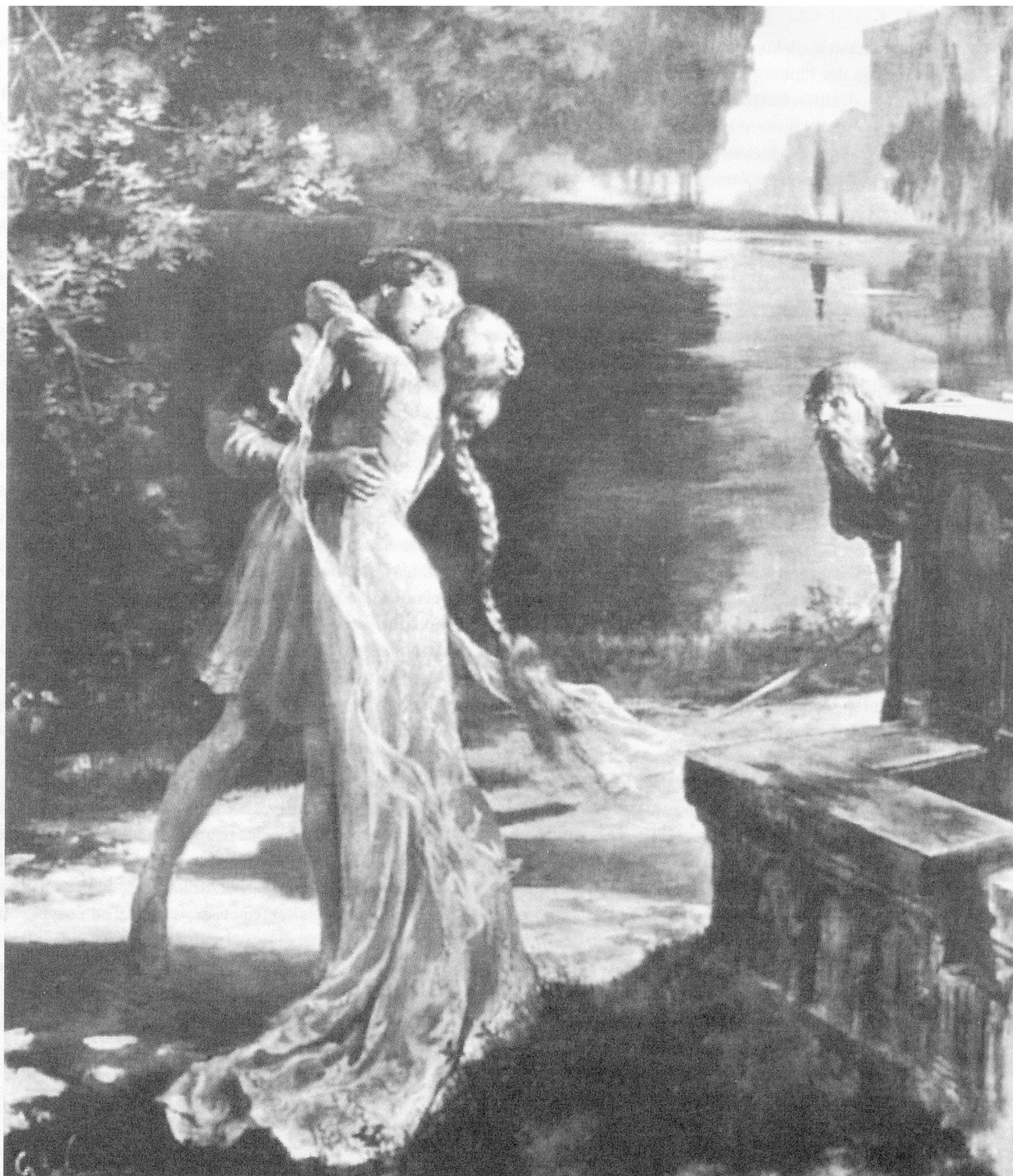
Plakat für «Pelléas et Mélisande», 1902 (Ausschnitt)

Ziel zu kommen und fallen sich unablässig gegenseitig ins Wort. In anderen Stücken wie Et la lune descend sur le temple qui fut , Brouillards oder Étude pour les cinq doigts führen die Vermeidung von Entwicklung und Lyrismus sowie die zeitlichen oder räumlichen melodisch-harmonischen Brüche zum Eindruck einer Collage kleiner Taktgruppen (bisweilen von nur einem oder zwei Takten Umfang). «Diese Diskontinuität des Diskurses, der Rhetorisches verwirft und Gefühlsausbrüchen misstraut» 21 , wird zu einer eigentlichen Kompositionstechnik, vergleichbar mit dem offensichtlich sinnlosen Gegenüberstellen der Szenen in Maeterlincks Hôpital (Serres Chaudes) oder der Antworten in Les Aveugles , vergleichbar auch mit dem Verfahren der Kubisten, verschiedene Blickwinkel eines einzelnen Objektes aufeinanderprallen zu lassen, vergleichbar schliesslich mit dem Gebrauch der Collagetechnik.