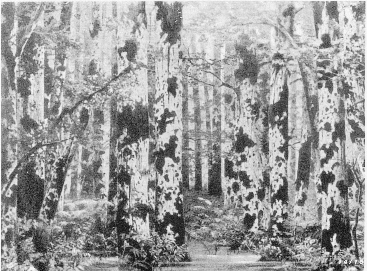
« Pelléas et Mélisande »: Der Wald. Bühnenbild von J. Lusseaume für die Erstaufführung (Paris, 1902, Opéra-Comique)