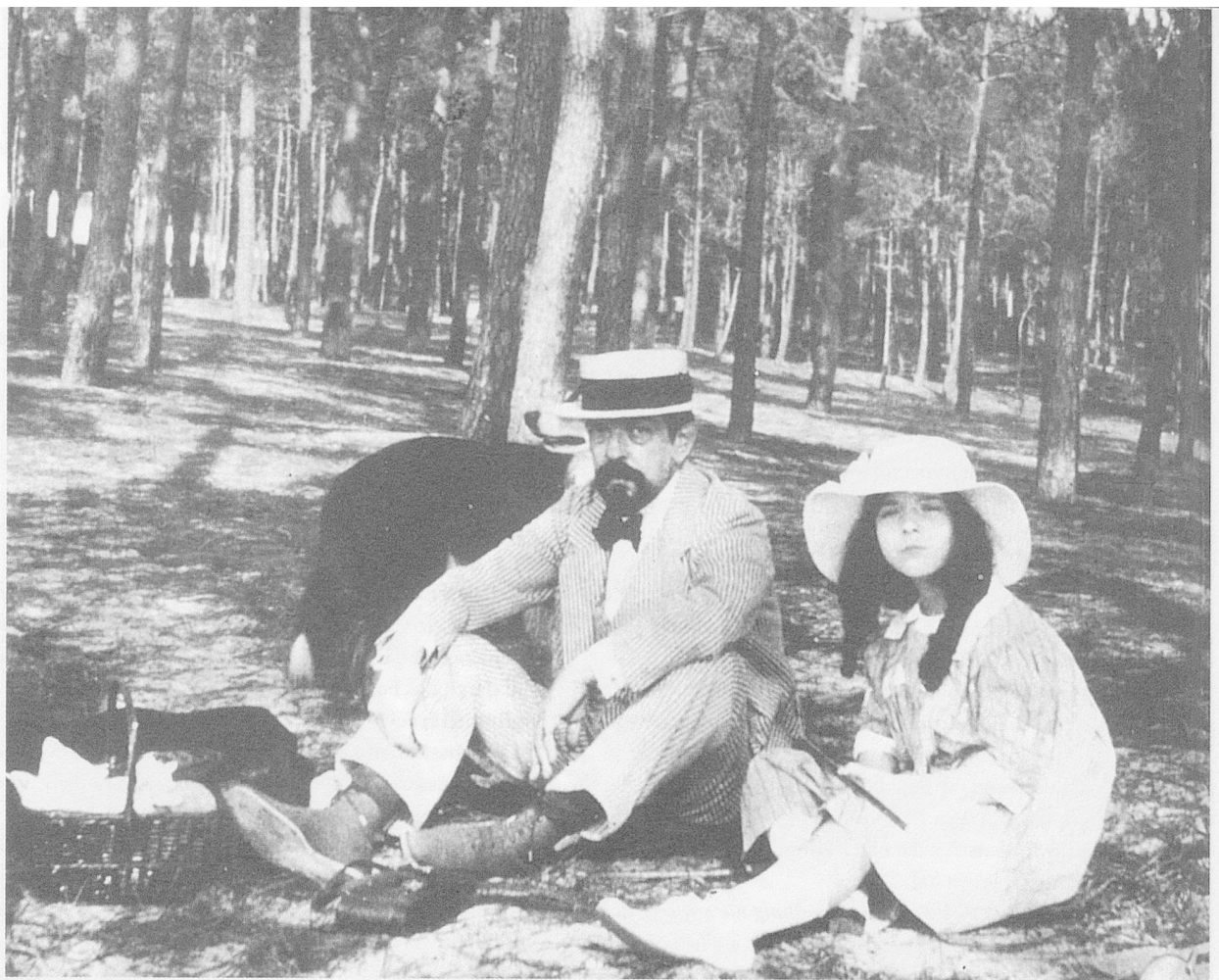
Claude Debussy und seine Tochter in Arcachon (1916)

nen. Übrigens war es Bergson, dem man die Formulierung dieses fortlaufenden, der Dauer eigenen Kontinuitätsgedankens verdankt: