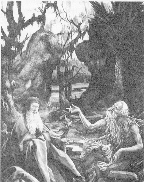
Mathias Grünewald: Der Isenheimer Altar (1515, Ausschnitt)