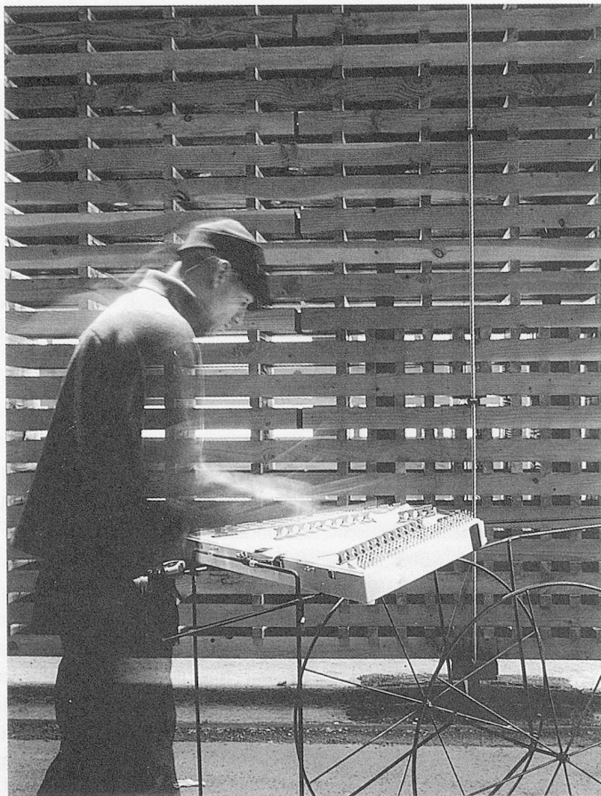
«Klangkörper Schweiz», Schweizer Pavillon an der Expo 2000

Klanginstallationen und Klangräume an der Expo 2000 in Hannover