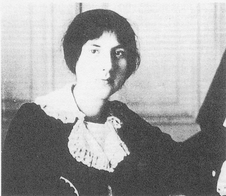
Lili Boulanger (Foto von 1913)

Das Leben Lili Boulangers (1893–1918), der jüngeren Schwester Nadias, war kurz und erfüllt, trotz einer schwankenden Gesundheit: Sie war die erste Frau, die den Rompreis gewann, und zwar 1913 mit der Kantate Faust et Hélène , einem Werk von staunenswerter Reife und