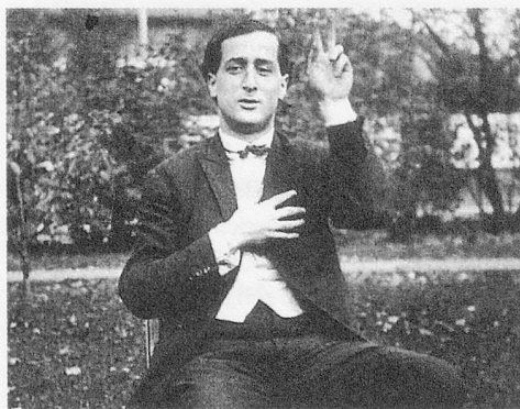
Stefan Wolpe in einem Berliner Garten (1925)

Elida ist nicht etwa eine Gespielin des Göttervaters, sondern eine Seife, für die auf Plakaten mit dem Bild einer jungen Frau geworben wird. Zeus hält diese nichtsdestotrotz für die Europa, die er auf allen Kontinenten gesucht hat, so wie er auch «Chlorodont» und «Pixavon» für Heimatklang und «Syphilis» für ein wunderbar betörendes Wort hält, weil es ihn an die Sylphiden erinnert. Die Verwirrung des alten Mannes wird vom Staatsanwalt in Berlin als subversiv qualifiziert und das Übel mit der Wurzel ausreißend, verbietet er kurzerhand den ganzen Potsdamer Platz, auf dem sich diese Groteske der 20er Jahre abspielt. Stefan Wolpe unterlegt in seiner Kurzoper Zeus und Elida den Aktionen des Staatsapparats ein «Konzert mit Variationen», in das sich Bach und