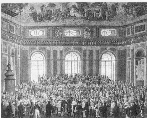
Aufführung von Haydns «Schöpfung» in der Alten Universität Wien (1808)

Feder, lange Jahre Editionsleiter der Haydn-Gesamtausgabe, gibt – entsprechend der Konzeption der Reihe «Werkeinführungen» – einen vielfältigen, reich mit Quellen gerade auch zur Entstehungs- und Aufführungsgeschichte ausgestatteten Überblick über das Werk. Zwar betont Feder etwas zu oft, wie «unangefochten Haydn seinem Katholizismus treu» blieb, akzentuiert in diesem Katholizismus aber die Weltzugewandtheit, ja Diesseitsorientierung. Ebenso ver-