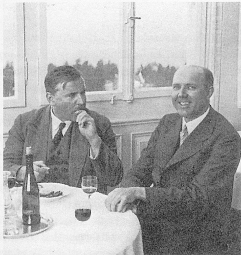
Othmar Schoeck mit Walter Giesecking vor einem Konzert in St. Gallen