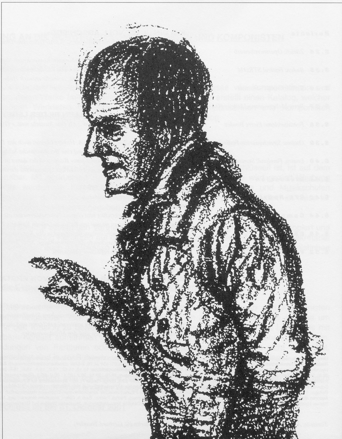
Zeichnung von J.G. Schreiner, «Hölderlin mit 55 Jahren». Vorlage für das «Akustik-Portraits» in Hubers «An Hölderlins Umnachtung»

Tonalität in Nicolaus A. Hubers Ensemblestück «An Hölderlins Umnachtung» (1992)