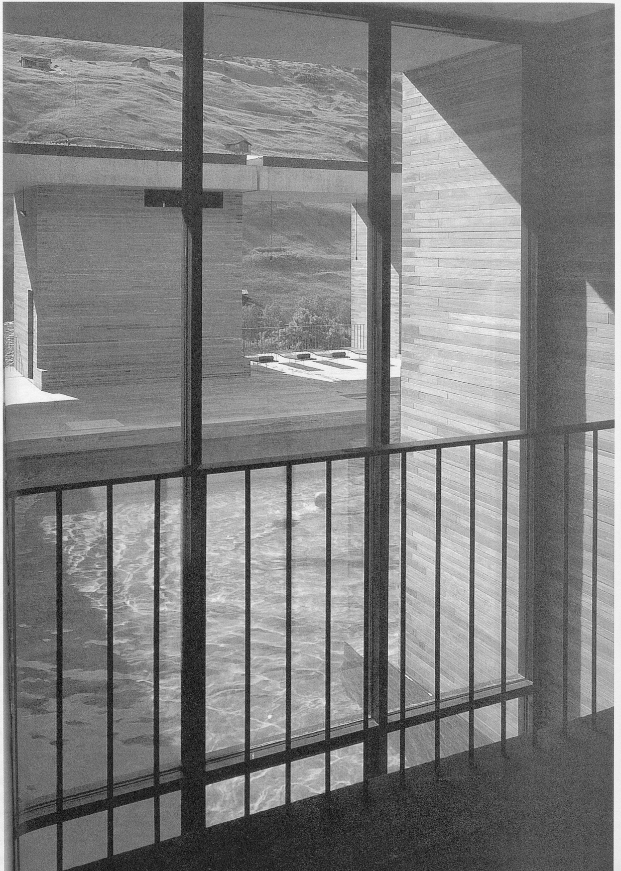
Kurbad Vals: Aussen- schwimmbad