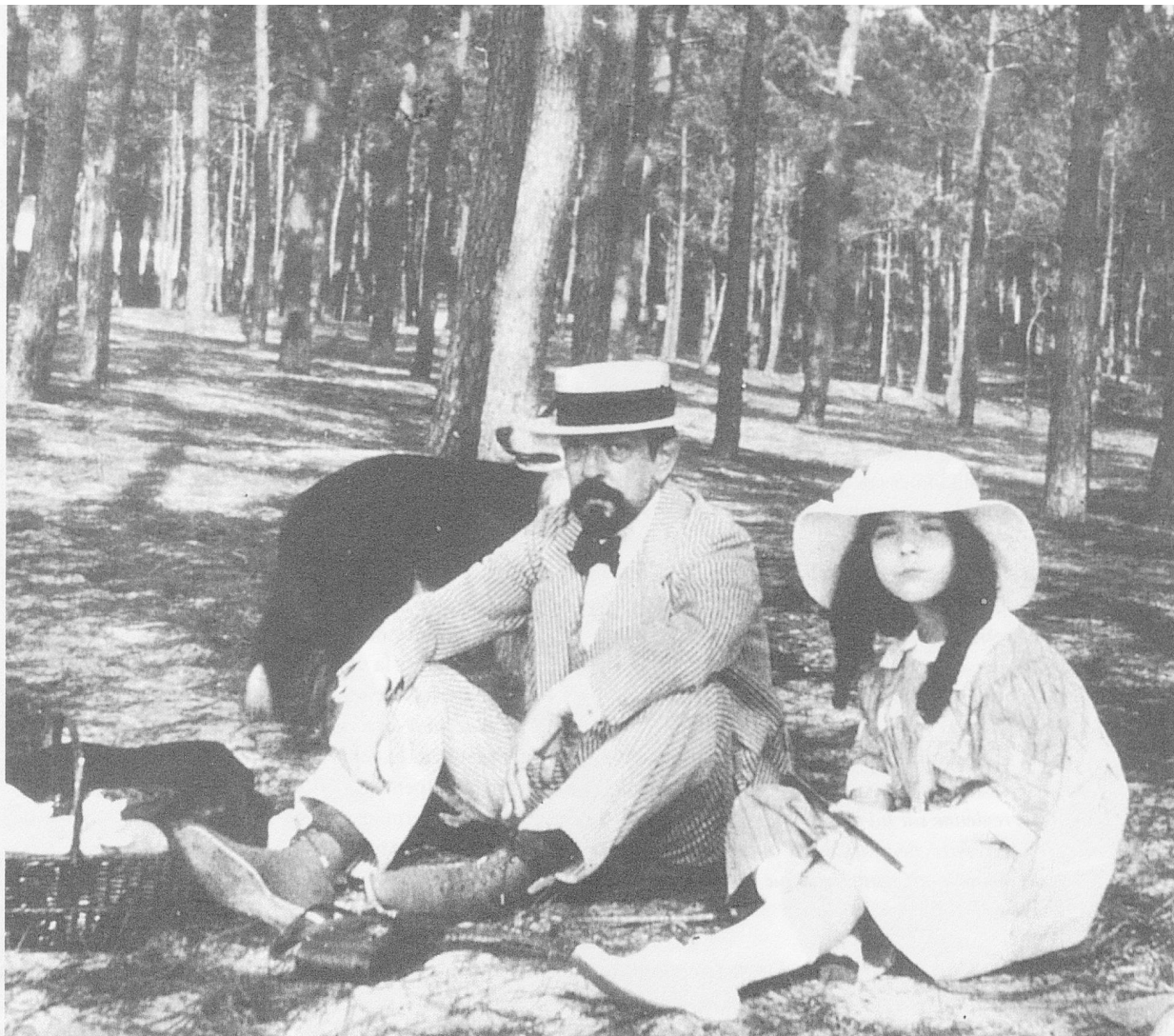
Claude Debussy et sa fille à Arcachon (1916)

«La vraie durée, celle que la conscience perçoit, devrait donc être rangée parmi les grandeurs dites intensives, si toutefois les intensités pouvaient s'appeler des grandeurs». 2