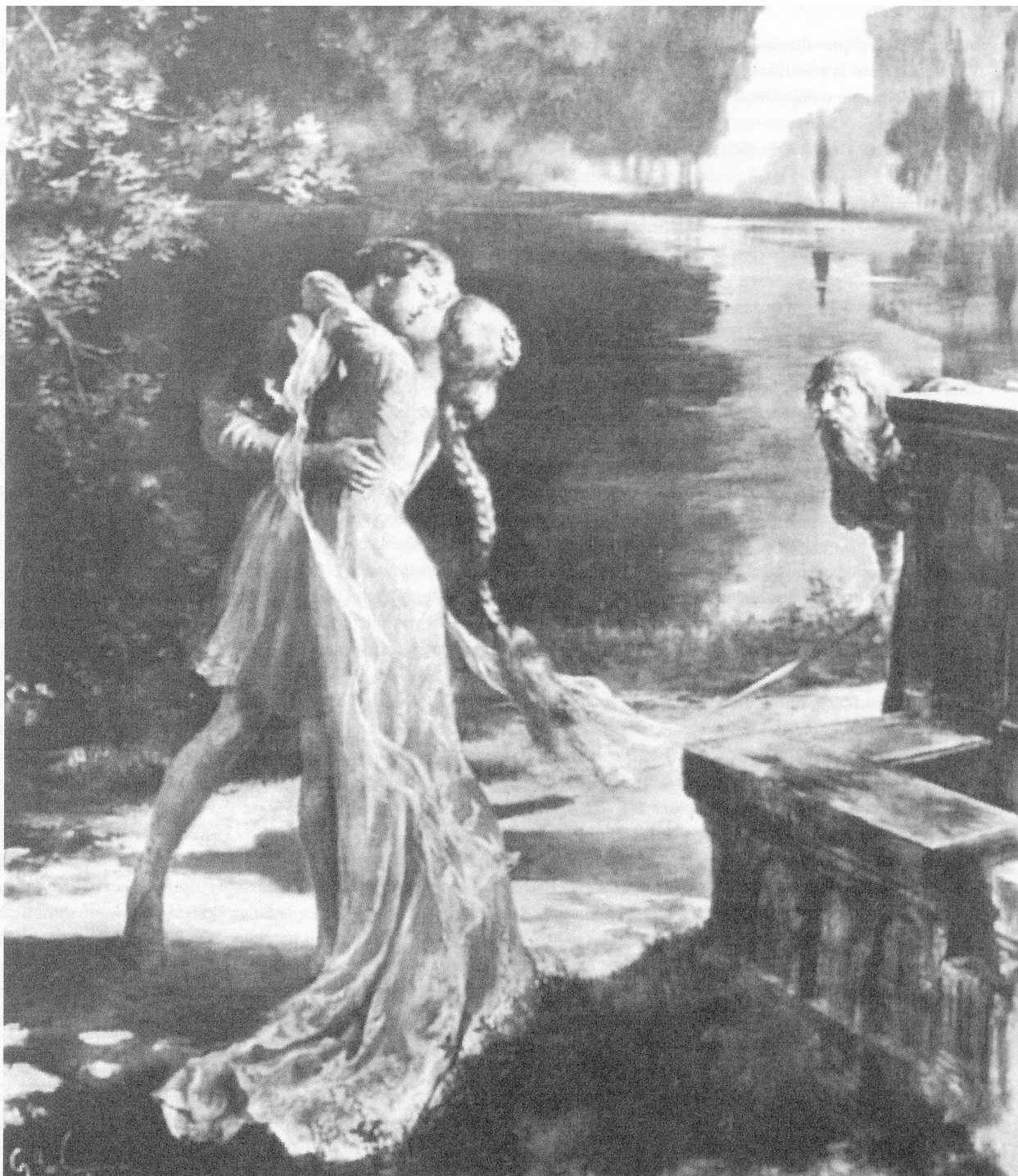
Affiche pour «Pelléas et Mélisande», 1902 (détail)

«créant un enchevêtrement des motifs et des structures qui disparaissent et réapparaissent de façon sporadique et parfois sous-jacente», des «développements absents», comme si la musique s'était déroulée ailleurs, suivant un parcours logiquement déductif, mais se trouvant sapée, par interruption, en des tranches d'oubli 23 . Le «temps tressé» que découvre Boulez 24 dans Jeux est l'image même de ce que Barraqué nomme la «continuité alternative» 25 . Dans ce ballet pour joueurs de tennis, la danse, d'abord timorée, prend de l'ampleur grâce aux interruptions dues aux faits et gestes des personnages. Et c'est justement lorsque le thème évoquant la danse disparaît momentanément qu'il se construit pour devenir véritable giration. Quel curieux paradoxe d'associer alors la continuité à ce qui était qualifié précédemment de discontinu! La philosophie qui sera, plus tard, celle de Bachelard, donne une signification à cette ambiguïté. Bachelard prolonge la pensée de Bergson tout en s'y opposant en considérant la durée comme forcément «décomposée» par la conscience. Par de multiples exemples, le philosophe montre que «l'âme ne continue pas de sentir, ni de penser, ni de réfléchir, ni de vouloir» 26 , mais qu'au