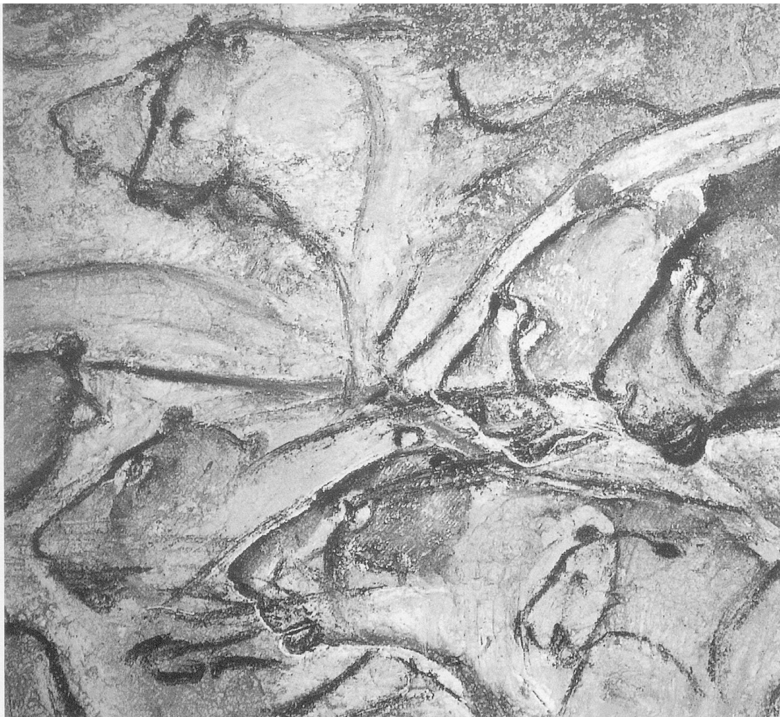
Grotte Chauvet, Salle du Fond : Panneau des Félins.

en effet que le compositeur, quand il s'exprime directement, croit faire davantage et produire quelque chose qui a une valeur supra-individuelle.