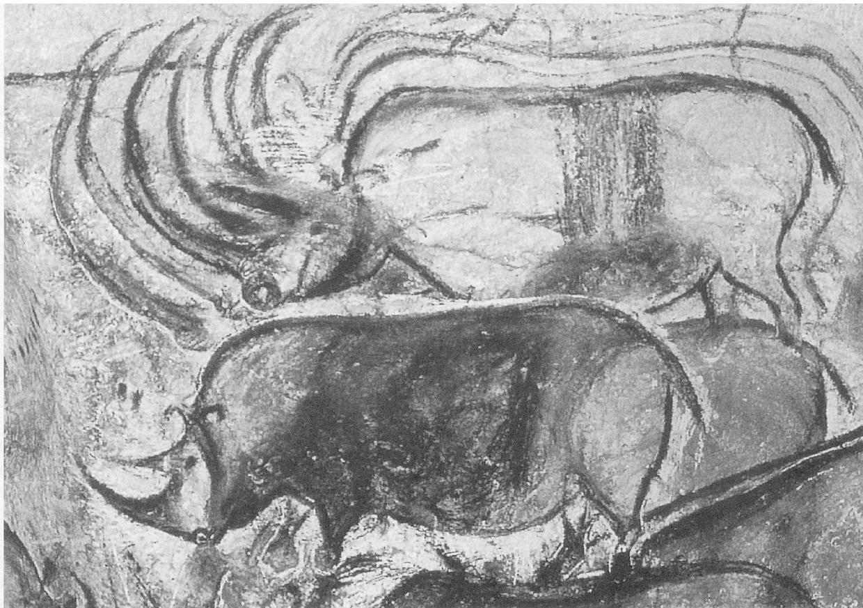
Grotte Chauvet, Salle du Fond : Panneau des rhinocéros

Mais je sais très bien que ce n'est pas de là que la question initiale tire son actualité (si elle provenait vraiment de là, ce dont nous devrions débattre ici serait tout différent). La problématique abordée me paraît se situer à un niveau infiniment plus banal, c'est-à-dire où d'aucuns affectionnent de parler de « postmodernisme » (terme que je ne considère d'ailleurs pas comme péjoratif), où l'on aime invoquer l'Angelus Novus de Benjamin-Klee, qui, le dos en avant (« une tempête souffle du Paradis 4 ») voit les débris du passé jetés à ses pieds. De ces débris, on pourrait tirer la leçon qu'un sentiment subjectif peut devenir paralysant lorsque l'on a l'impression certaine de ne vraiment plus pouvoir rien faire soi-même, sinon remodeler ce qui a déjà été modelé. L'acte de « former des formes » ( Gestalten gestalten ) renvoie ici à un phénomène fondamental du travail du compositeur ou de tout artiste. Certes, personne ne part de zéro, mais chacun travaille et modèle ce qu'il fait sur la base de ce que d'autres ont déjà préparé – pour lui, aussi. Il en a toujours été ainsi. Mais que se passe-t-il lorsque, pendant le travail, les accents se déplacent au point que presque tout ce qu'on trouve semble avoir été déjà traité et travaillé, donc déjà modelé ?