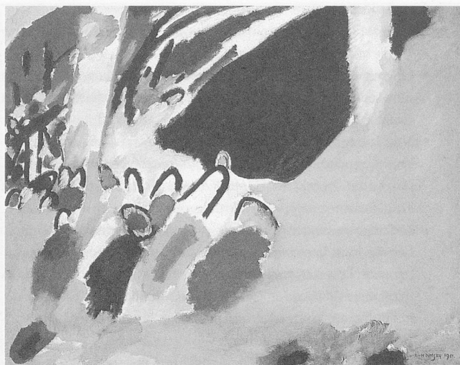
Wassily Kandinsky, « Impression III, 1911 »

Visualiser et développer ses propres idées est important pour que les improvisations puissent être conservées et répétées. Mais il se produit aussi un transfert sur un autre plan : le transfert de la succession notée du temps. Les proportions apparaissent. La notation entraîne à son tour des réflexions sur la conception initiale et approfondit donc l'acte de composition.