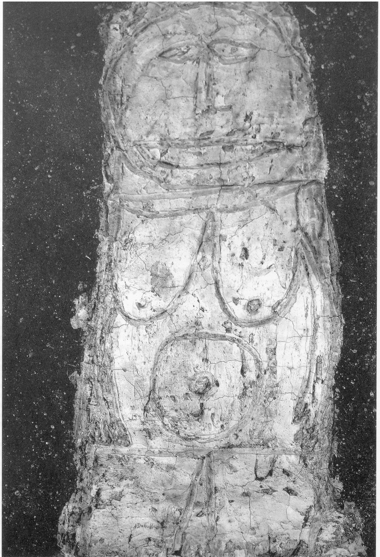
Abbildung 4: Jean Dubuffet; «Vénus du trottoir» (1946) Öl auf Stuckplatte, 102x82 cm, «Catalogue des travaux de Jean Dubuffet», elaboré par Max Loreau, Fascicule II, Lausanne 1964, No. 144, Musée Cantini, Marseille (ehemals in Besitz von Georges Limbour).