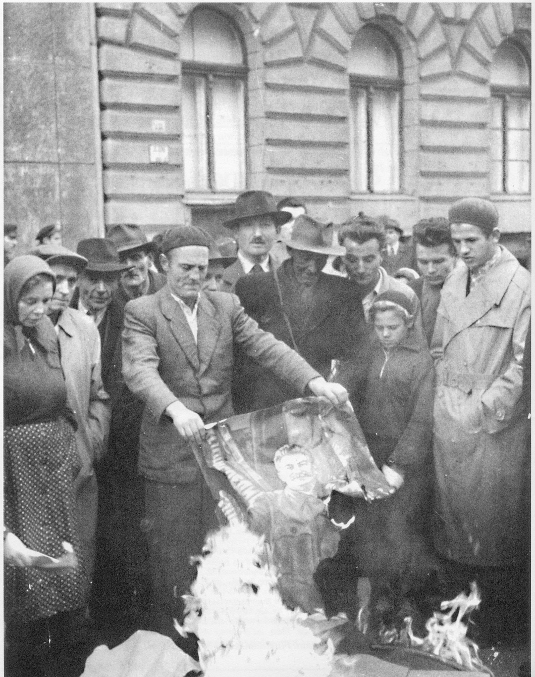
In Budapest, 12. November 1956