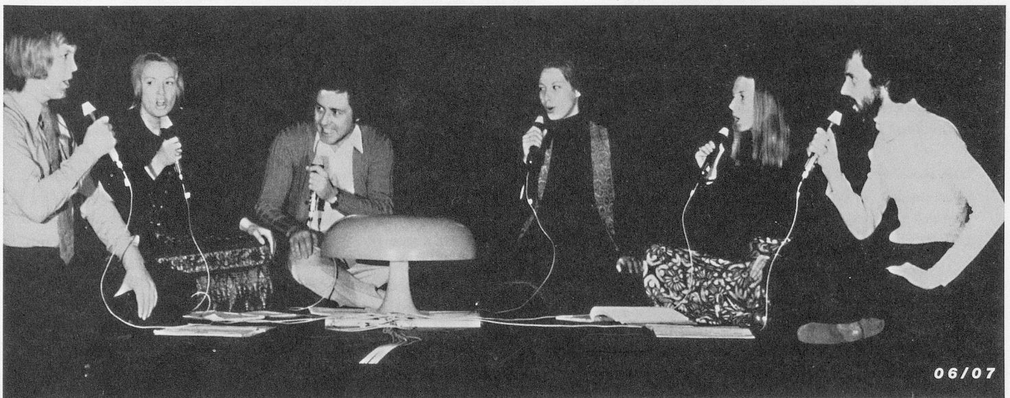
Abbildung 3: Karlheinz Stockhausen, «Stimmung» (1968), Aufführung durch das Collegium vocale Köln, um 1969. © Universal Edition Wien