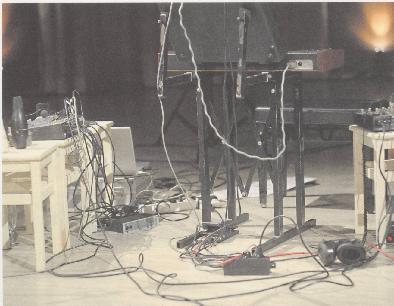
Utensilien auf der Bühne der Basler Gare du Nord, die das Trio TOOT (Axel Dörner: Trompete, Phil Minton: Stimme, Thomas Lehn: Elektronik) am 30. Januar 2009 zum Improvisieren benötigte.