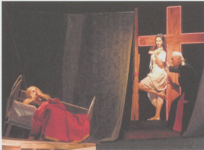
Auf der Grenze zum Zirkus-Musikantischen: Thüring Bräms Kammeroper «Aloïse Opéra».