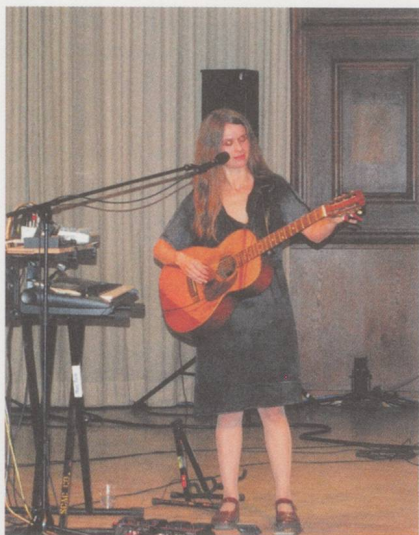
Frau Musica Electronica mit Gitarre: Juana Molina in Basel.

Das «dBâle electronic music festival» in der Gare du Nord Basel (21.–23.4.2010)