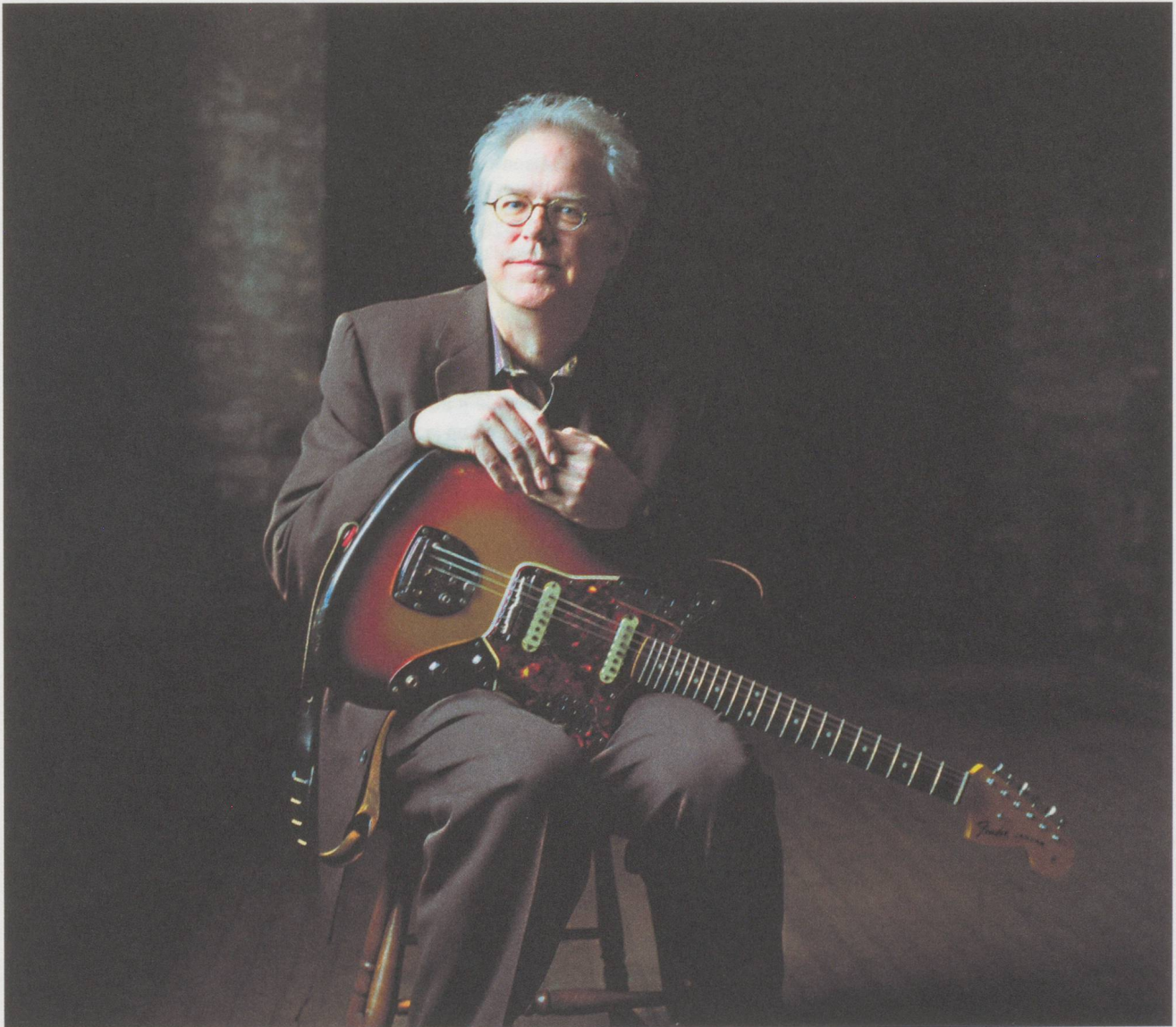
Bill Frisell.