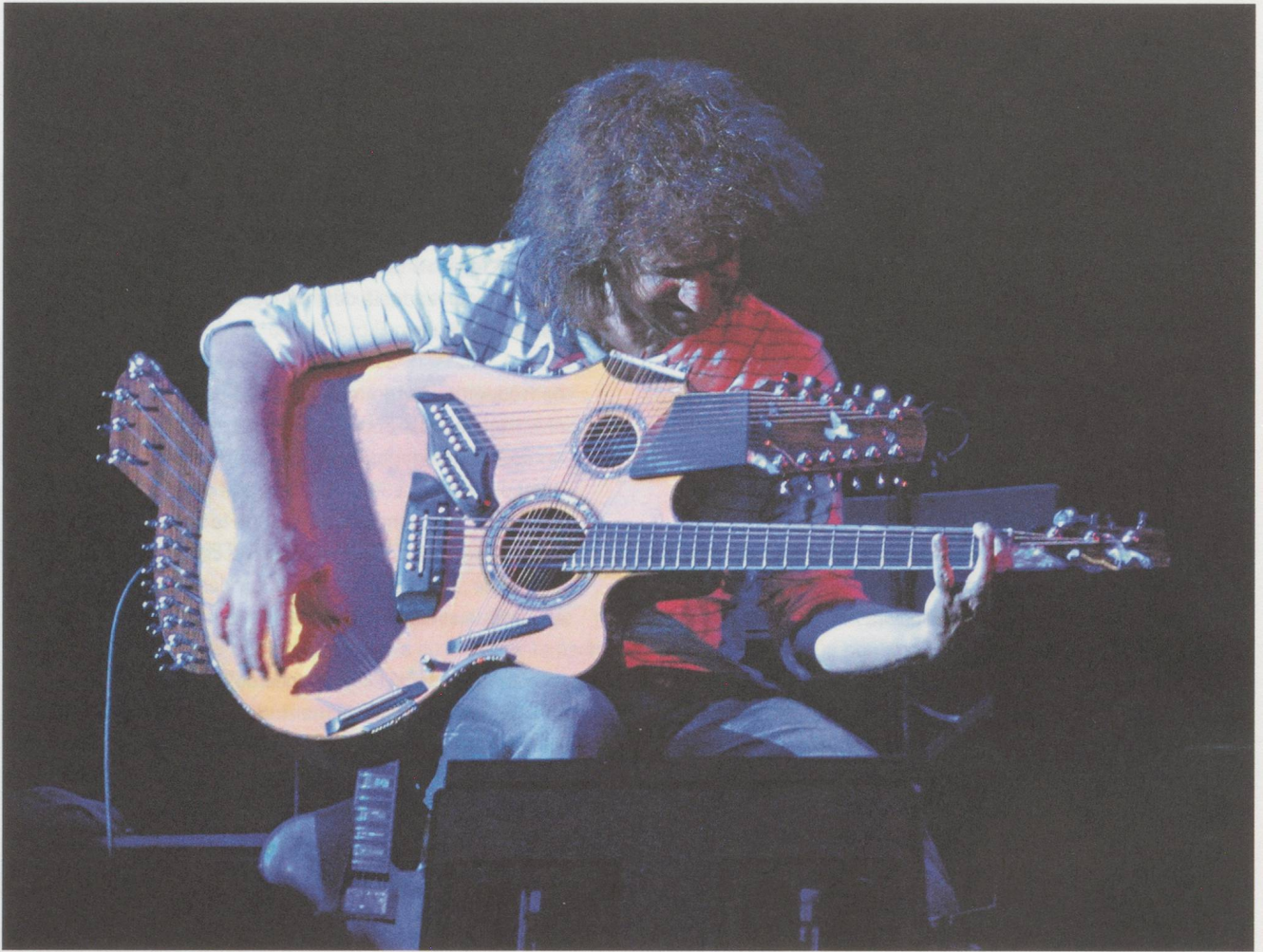
Pat Metheny et sa guitare «Pikasso» à 42 cordes.

d'autres) trop malentendus par son oreille dialectique. Il ne s'agit pas de jouer Stella by Starlight dans sa signification supposée dernière et univoque préalablement donnée, mais de montrer comment Stella by Starlight diffère d'elle-même : c'est là le paradoxe au cœur de la pratique jazzistique qui échappait au philosophe de Francfort. Les versions qu'avaient proposées Miles Davis aux années soixante et Keith Jarrett aux années quatre-vingt exemplifient deux parmi n modalités de resingularisation d'une instance qui n'en est pas une : modèle sans origine, sans commencement absolu.