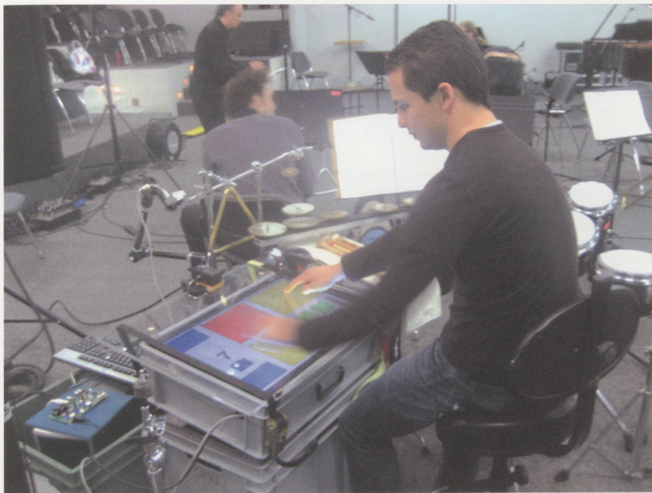
Présentation de «Una Cortina de Fun» à la HEM-GE, juin 2009.