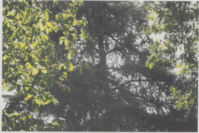
Wie klingen Bäume? Akustische Emissionen ökophysiologischer Prozesse untersucht das Zürcher ICST gemeinsam mit der Eidgenössischen Forschungsanstalt für Wald, Schnee und Landschaft.

der universitären Musikwissenschaft mit der praxisorientierten Forschung der Musikhochschulen kann auch durchaus gut funktionieren, wie es die gemeinsamen Aktivitäten und Publikationen in Bern und Basel zeigen.