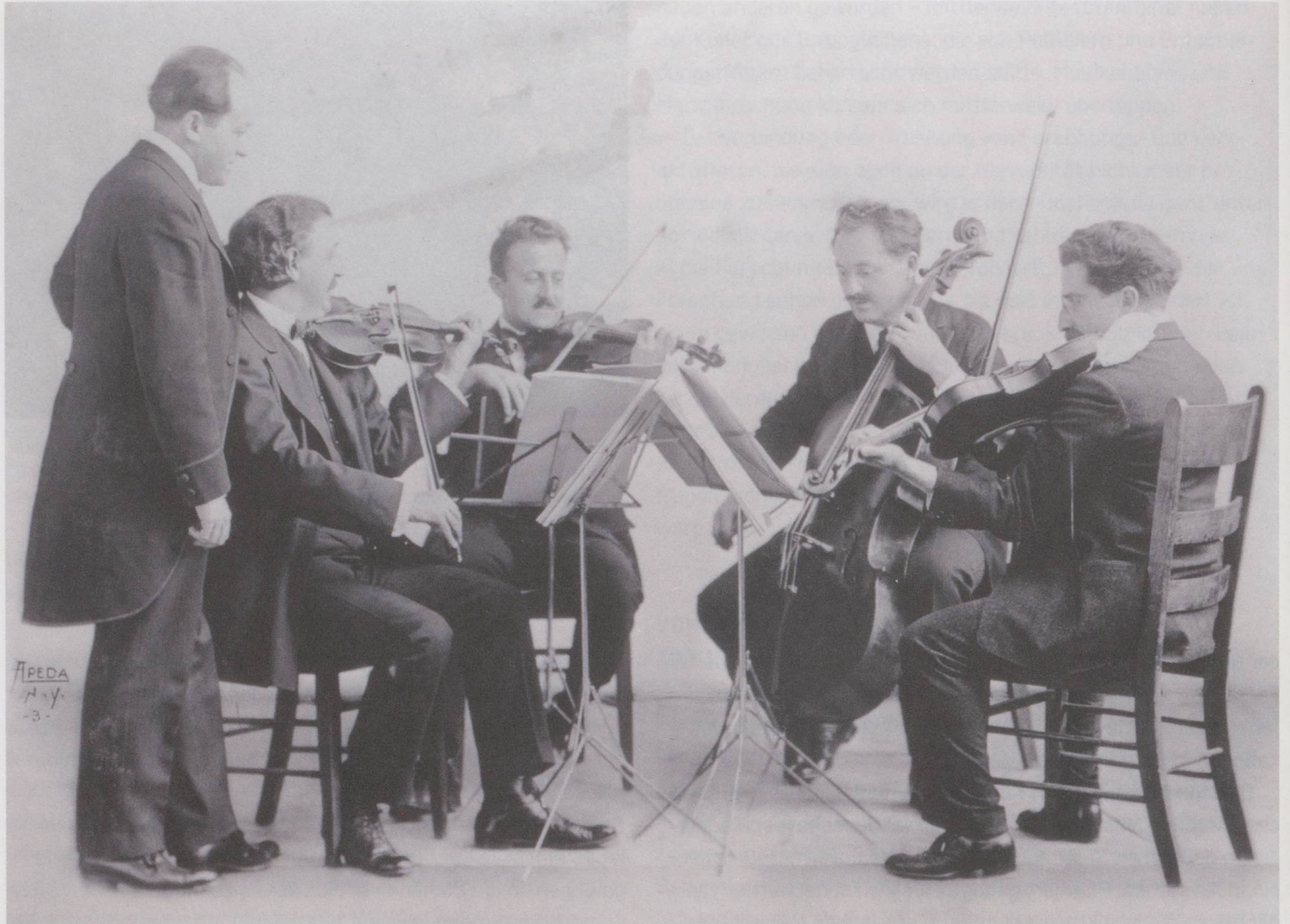
An der Hochschule Luzern – Musik untersucht ein vom SNF gefördertes Forschungsprojekt die Interpretationspraxis des schweizerisch-amerikanischen Quatuor du Flonzaley. Die Fotografie aus dem Jahr 1916 zeigt die Gründungsmitglieder (Adolfo Betti, 1. Vl; Alfred Pochon, 2. Vl; Ugo Ara, Va; Iwan d'Archangeau, Vc) zusammen mit Ernest Bloch (stehend). Sie entstand im Umfeld der Uraufführung von Blochs erstem, dem Flonzaley-Quartett gewidmeten Streichquartett in New York.